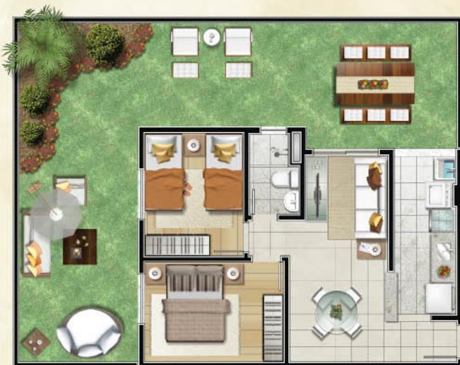
Ref. apto. 107B.02