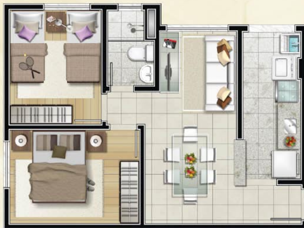
Ref. apto. 206B.02