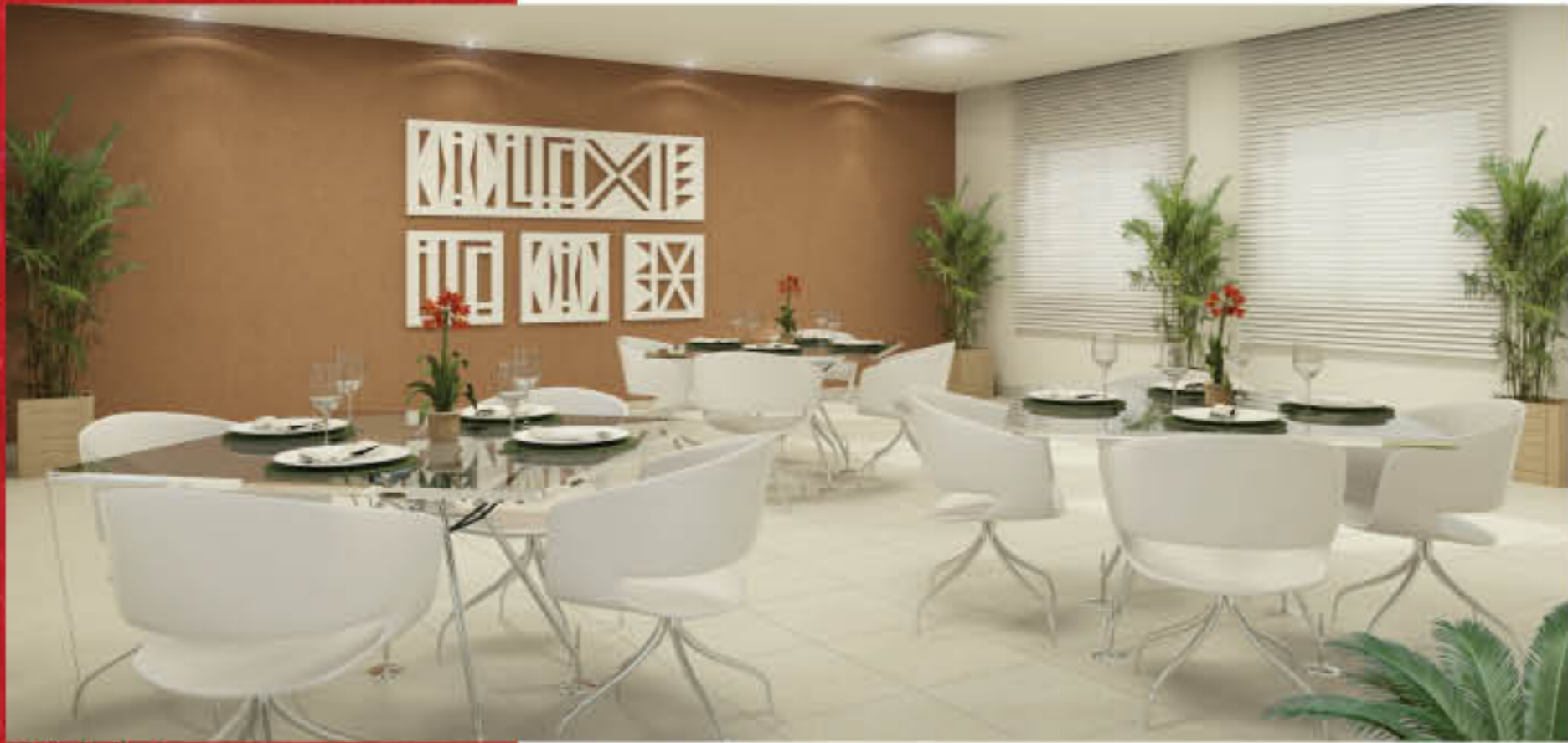
Salão de festas