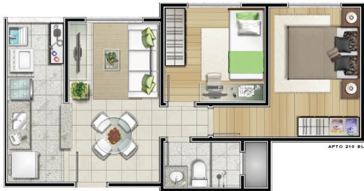
APTO 210 BL1