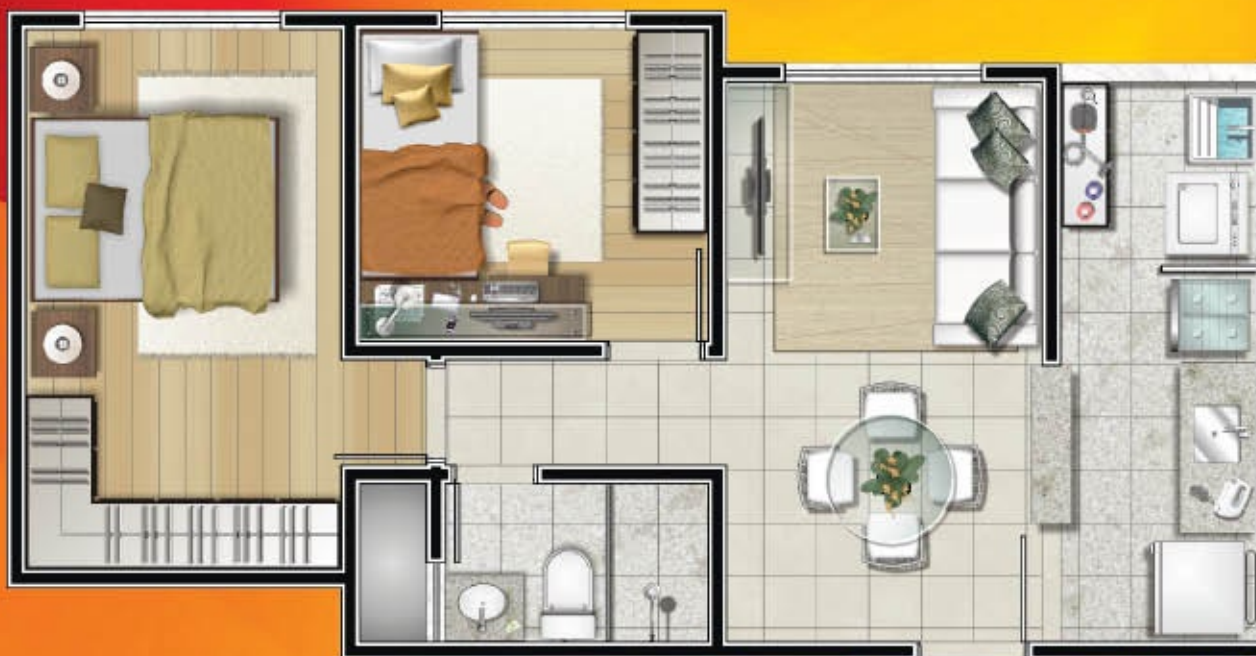
APTO 211 BL1