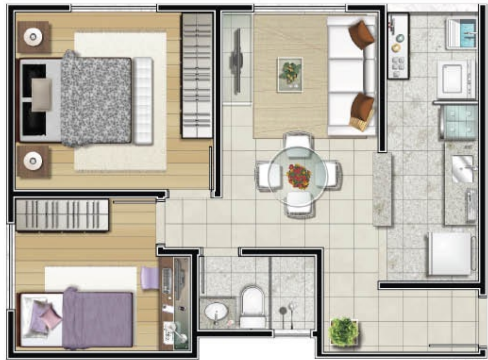
APTO 212 BL1