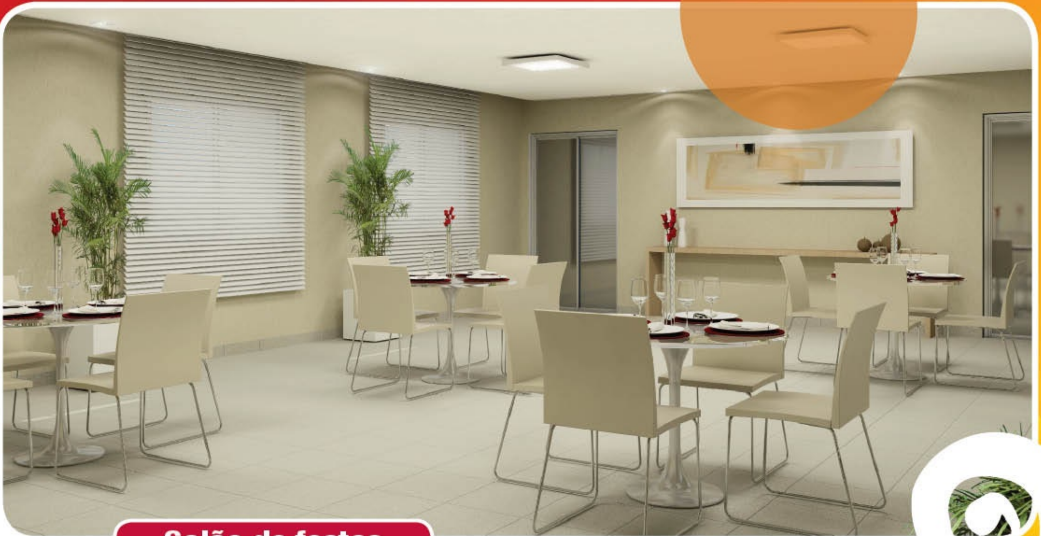
Salão de festas

Frequente as melhores festas sem sair de casa.