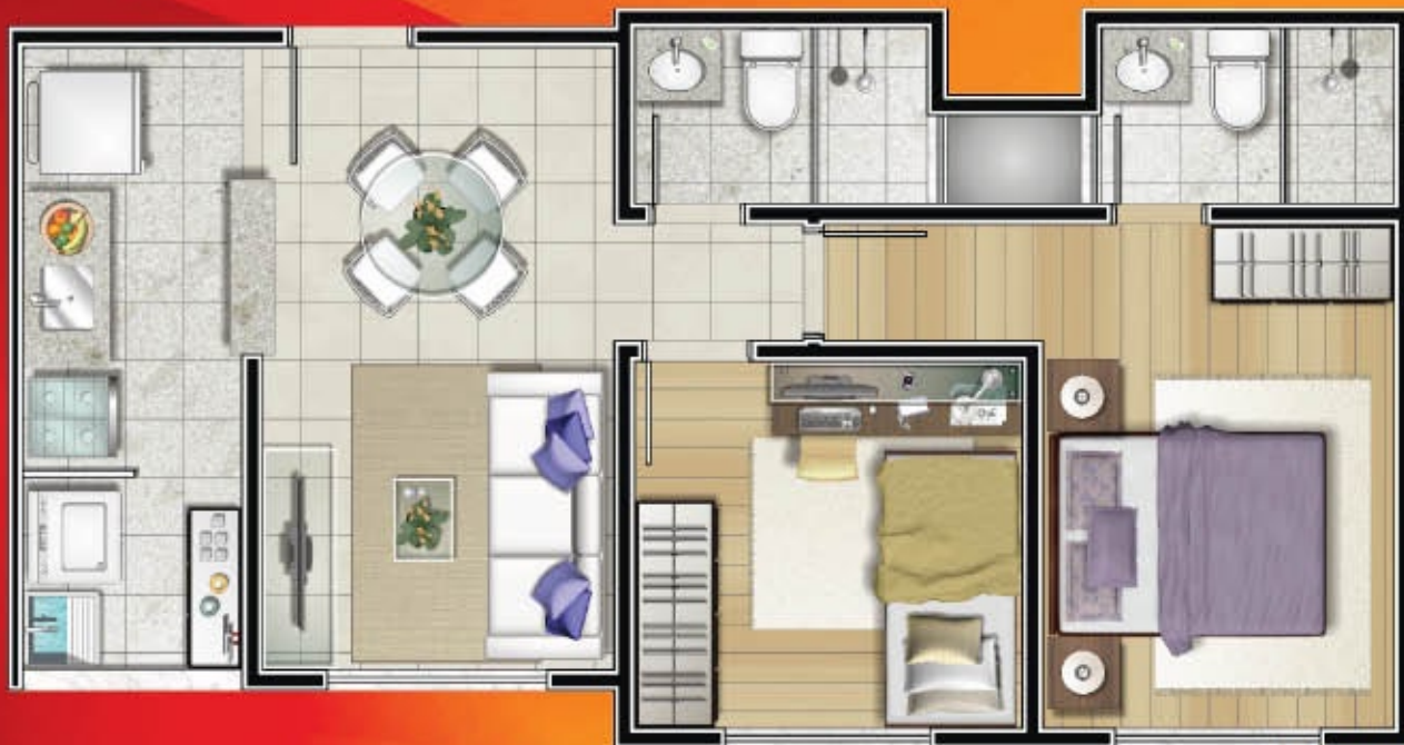
APTO 203 BL1