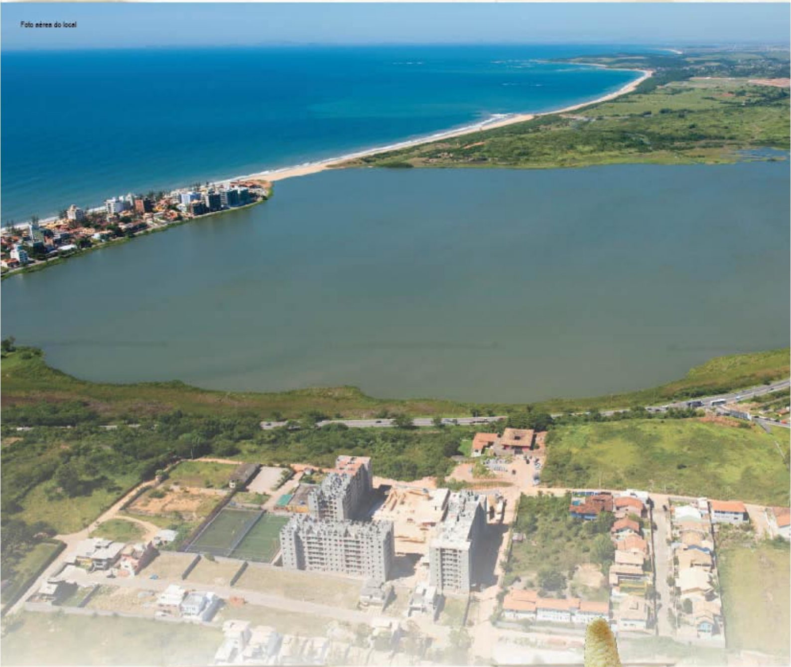
Foto aérea do local