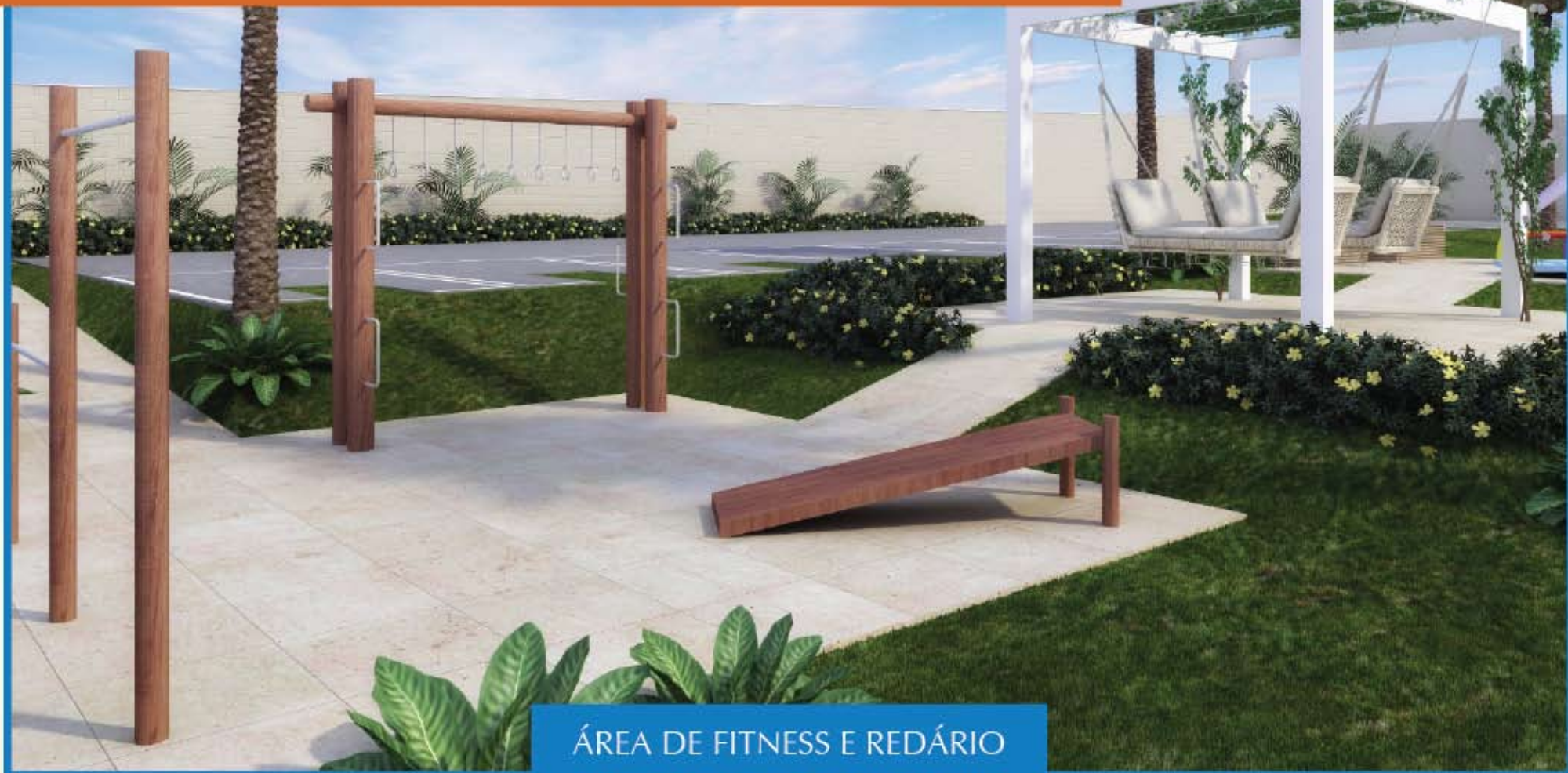
ÁREA DE FITNESS E REDÁRIO