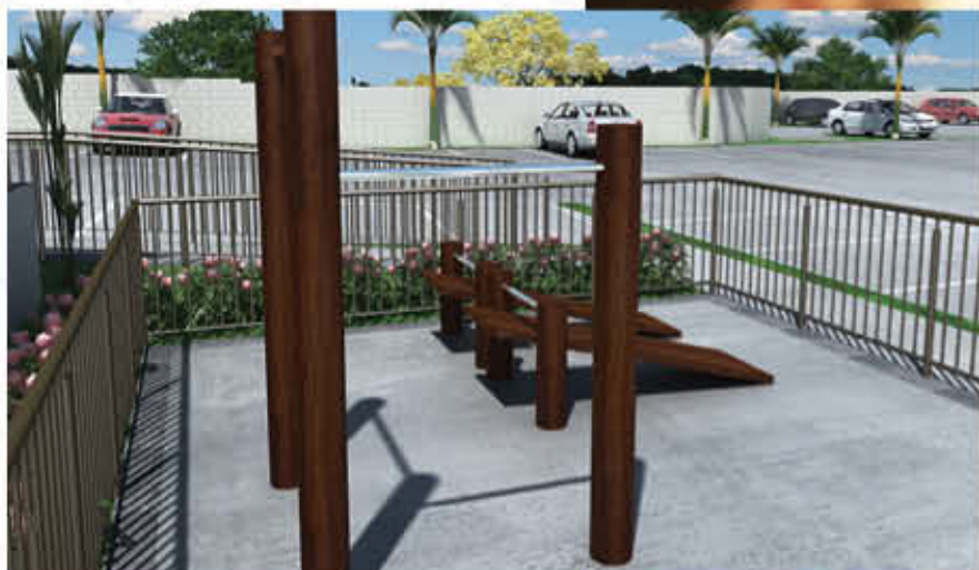
ÁREA DE FITNESS