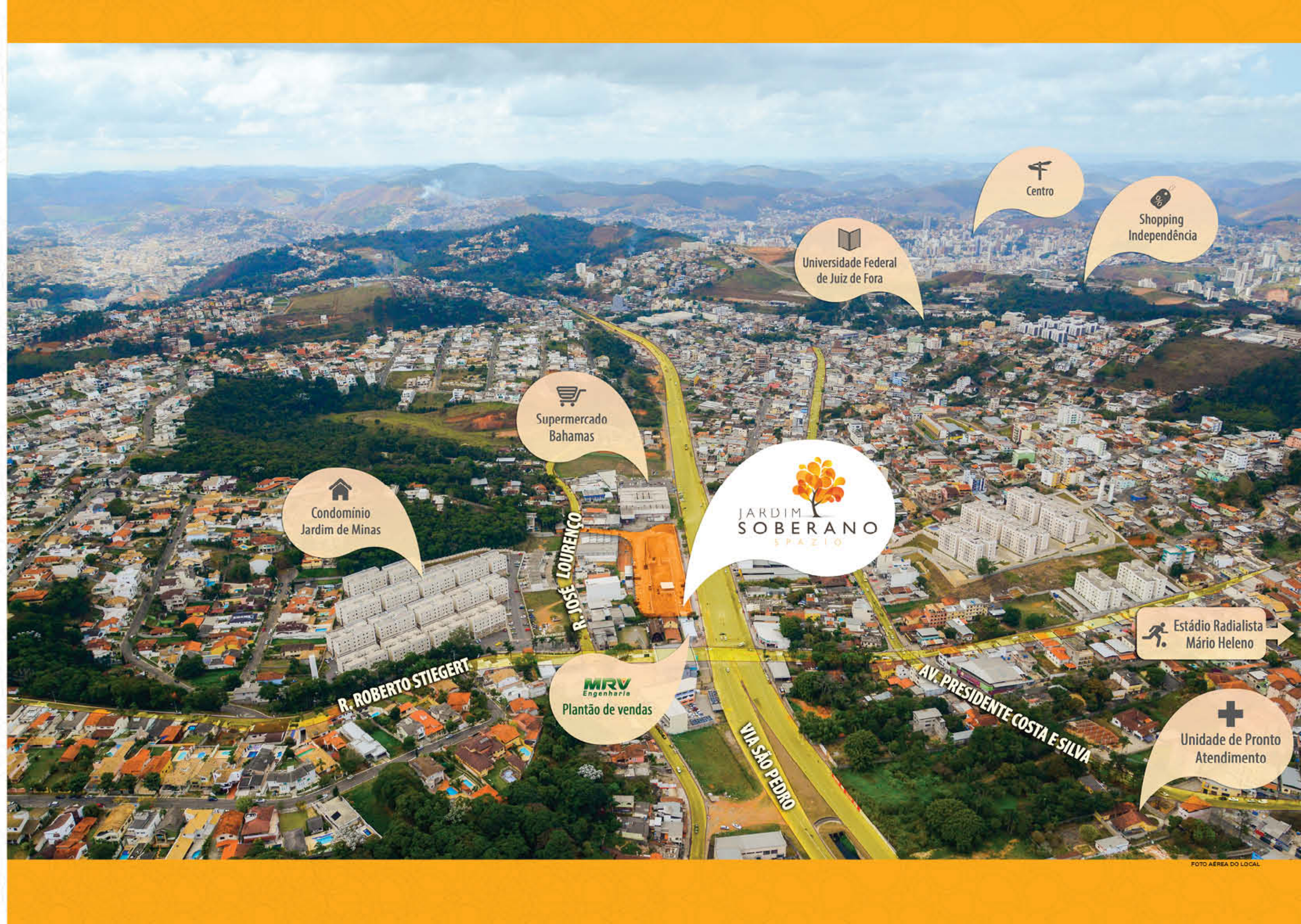
FOTO AÉREA DO LOCAL