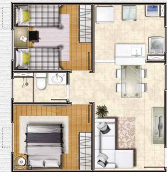
Ref.: unid. 201, bl. 09