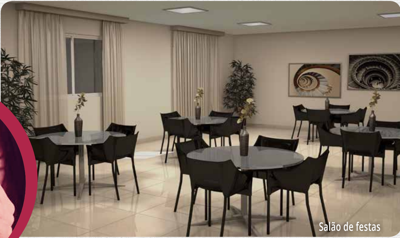
Salão de festas

Perspectivas artísticas. Este material tem caráter meramente ilustrativo por se tratar de bens a ser construído. O mobiliário e os equipamentos não fazem parte do contrato de compra e venda. Os materiais e cores representados poderão sofrer pequenas alterações sem prejuízo ao ano em função da disponibilidade dos mesmos no mercado.