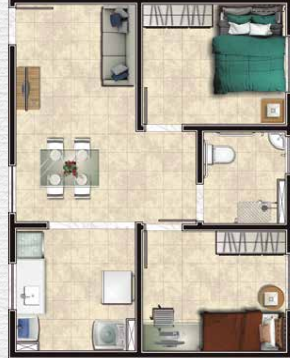
Ref.: unid. 104, bl. 06