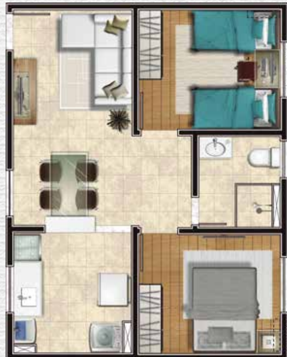
Ref.: unid. 404, bl. 06