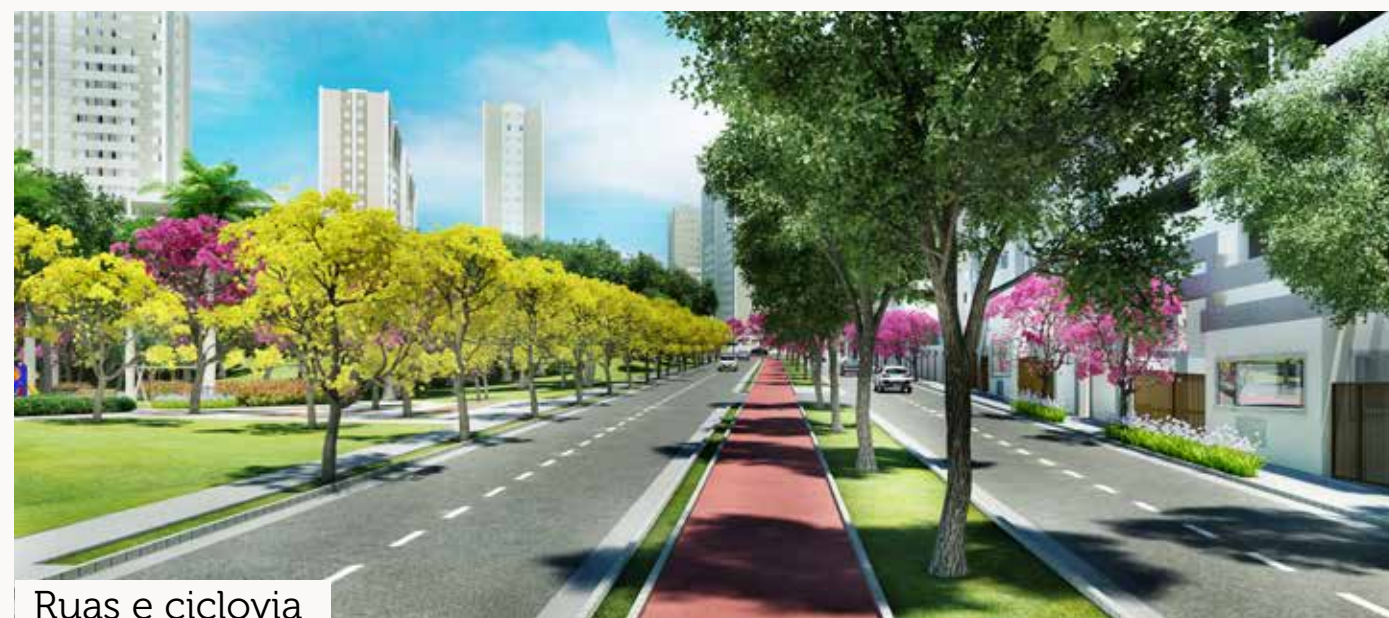
Ruas e ciclovia

UM VERDADEIRO BAIRRO PLANEJADO SOB MEDIDA PARA O SEU PROJETO DE VIDA.