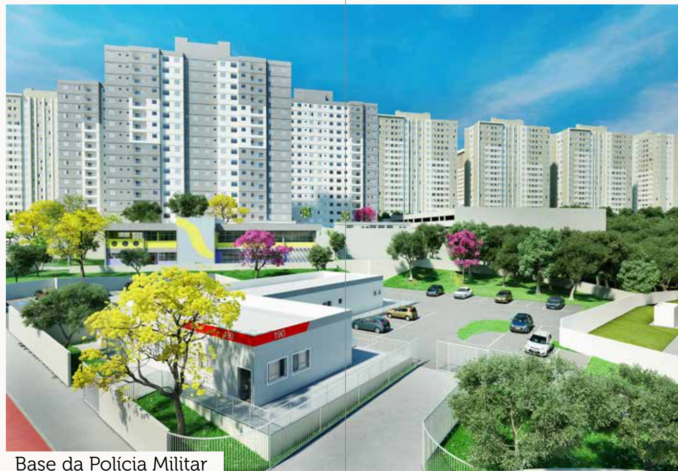
Base da Polícia Militar