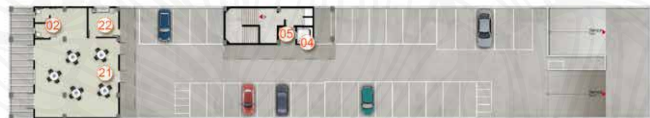
Garagem 5º Pavimento - Lazer