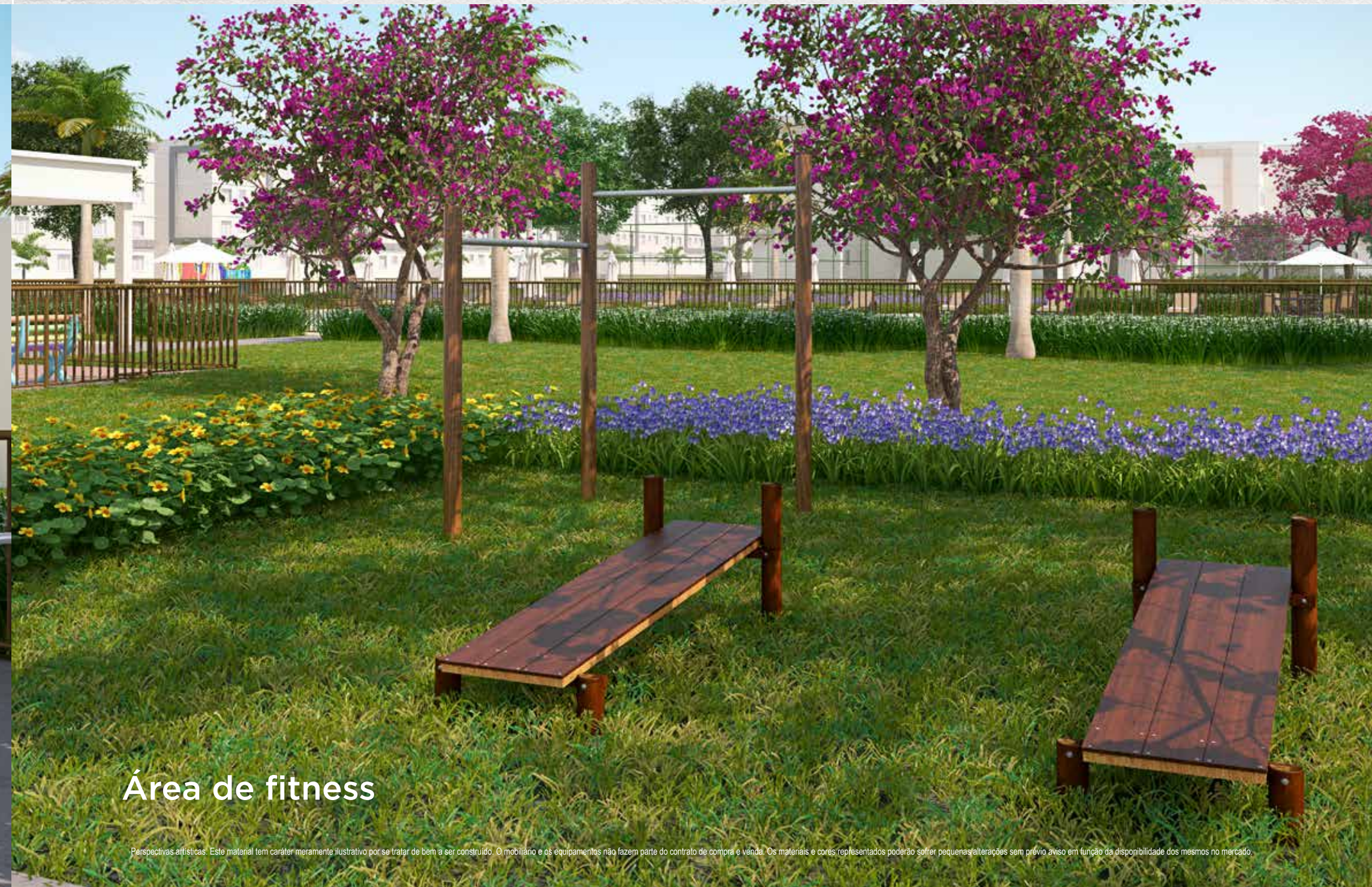
Área de fitness