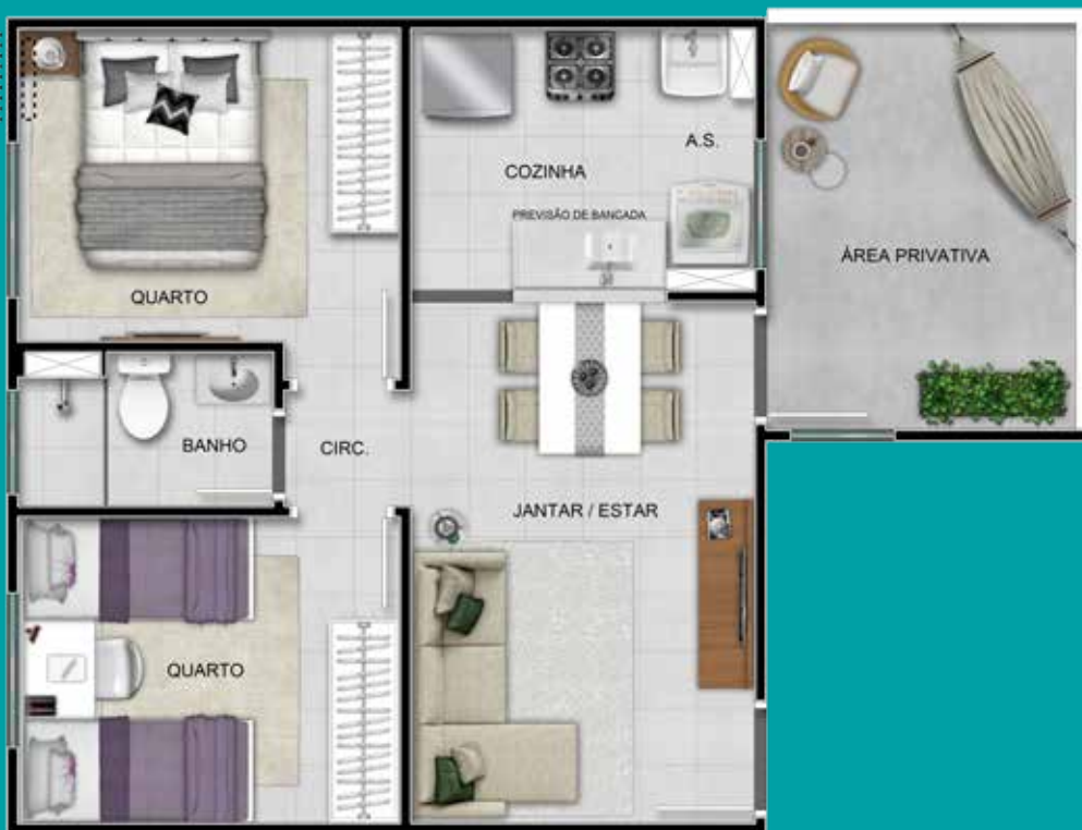
Ref. Apto. 101 - Boco 2