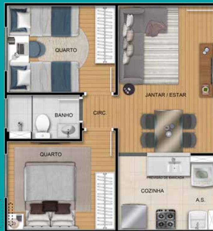
Ref. Apto. 202 - Boco 2