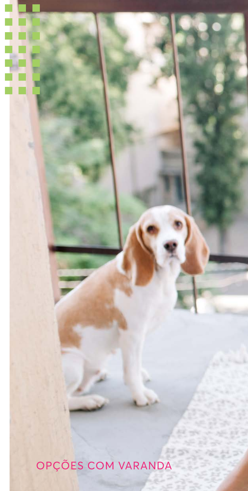
OPÇÕES COM VARANDA