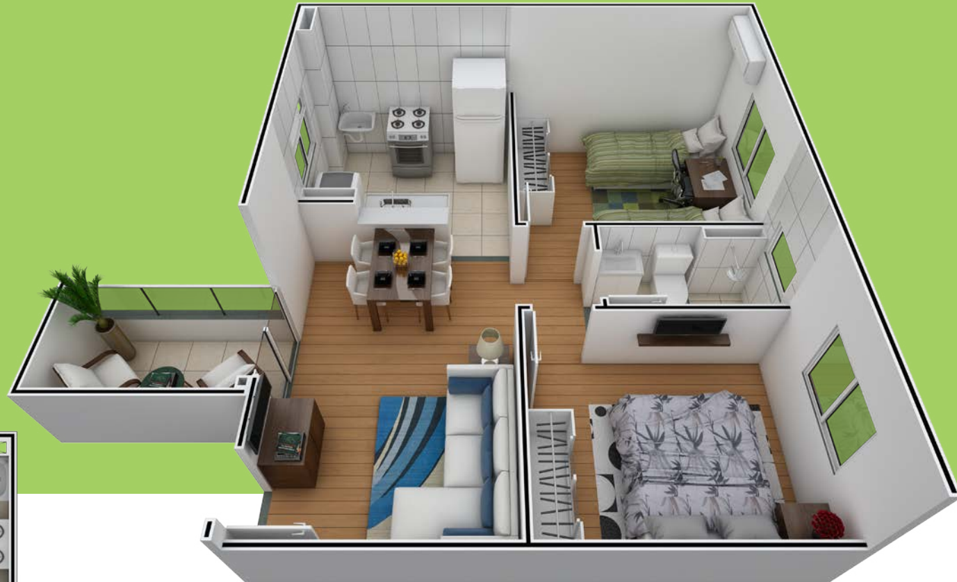
Ref.: Apto. 202 - Bloco 3