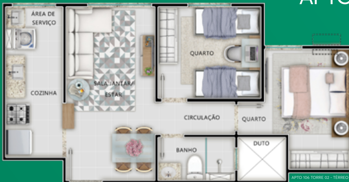
APTO 106 TORRE 02 - TÉRREO