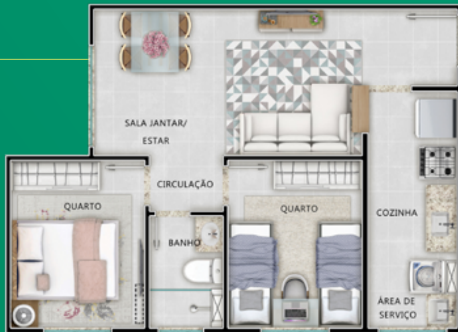
APTO 107 TORRE 01 - TÉRREO