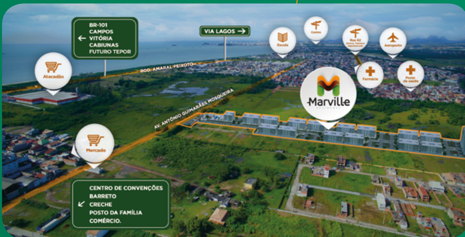
Foto aérea do local