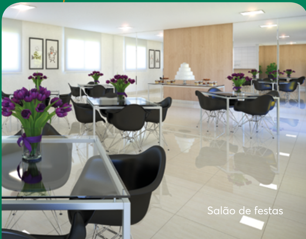
Salão de festas