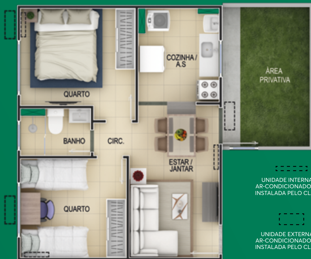
Ref.: Apto. 101 - Bloco 3