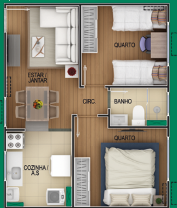
Ref.: Apto. 204 - Bloco 2

A decoração é mera sugestão, esta planta poderá sofrer variações decorrentes do atendimento das posturas municipais, das concessionárias e do local. Não fazem parte do apartamento o acabamento dos pisos e bancadas, podendo ser adquiridos pelo Exclusivité.