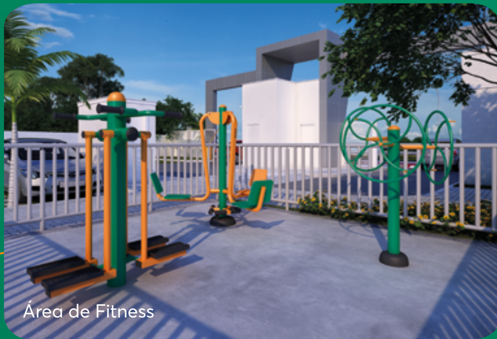
Área de Fitness