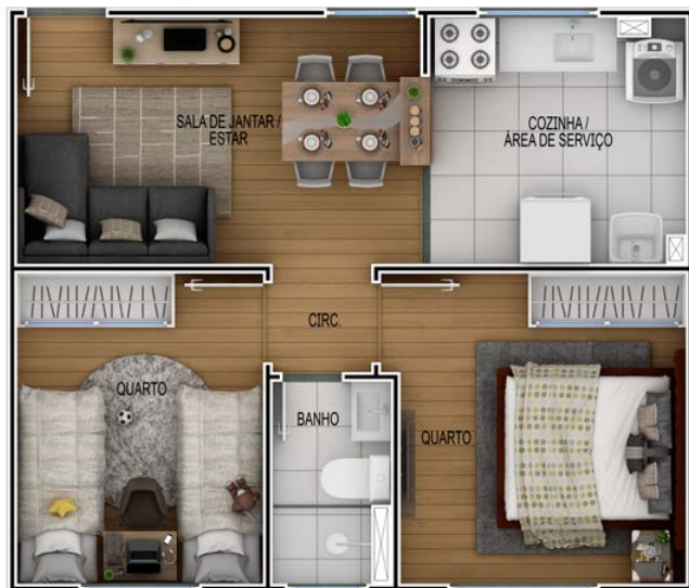
APTO 202 | BLOCO 03