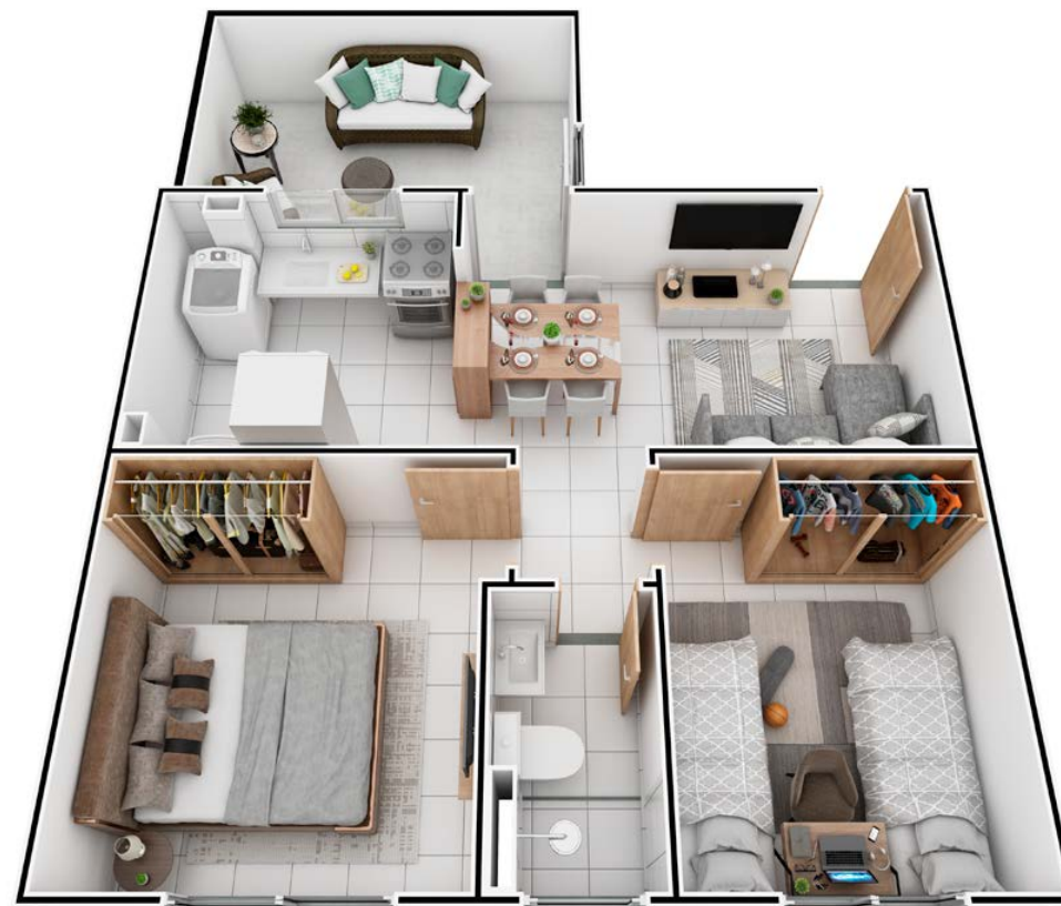
APTO 101 | BLOCO 03

ESPAÇO E FUNCIONALIDADE DESENHADOS PARA VOCÊ.