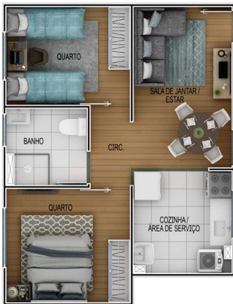
APTO 202 | BLOCO 01