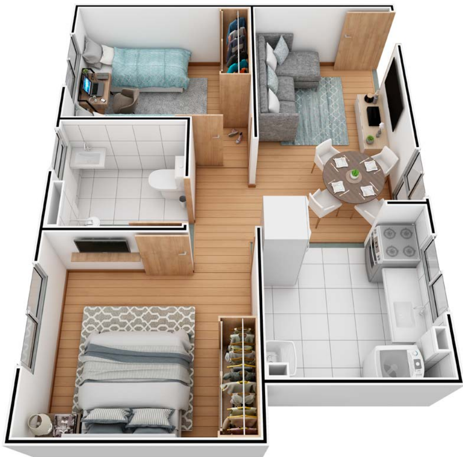
APTO 202 | BLOCO 01