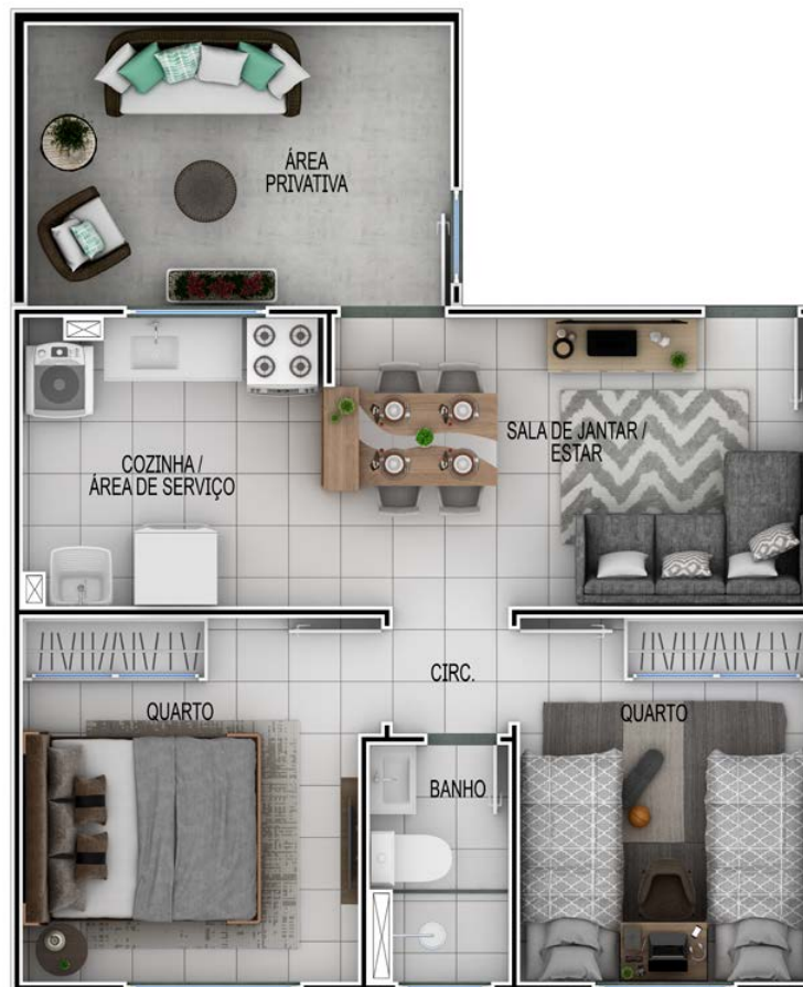
APTO 101 | BLOCO 03

AMBIENTE NA MEDIDA DO SEU CONFORTO OU COM UM CHARME DAS ÁREAS GIARDINO.