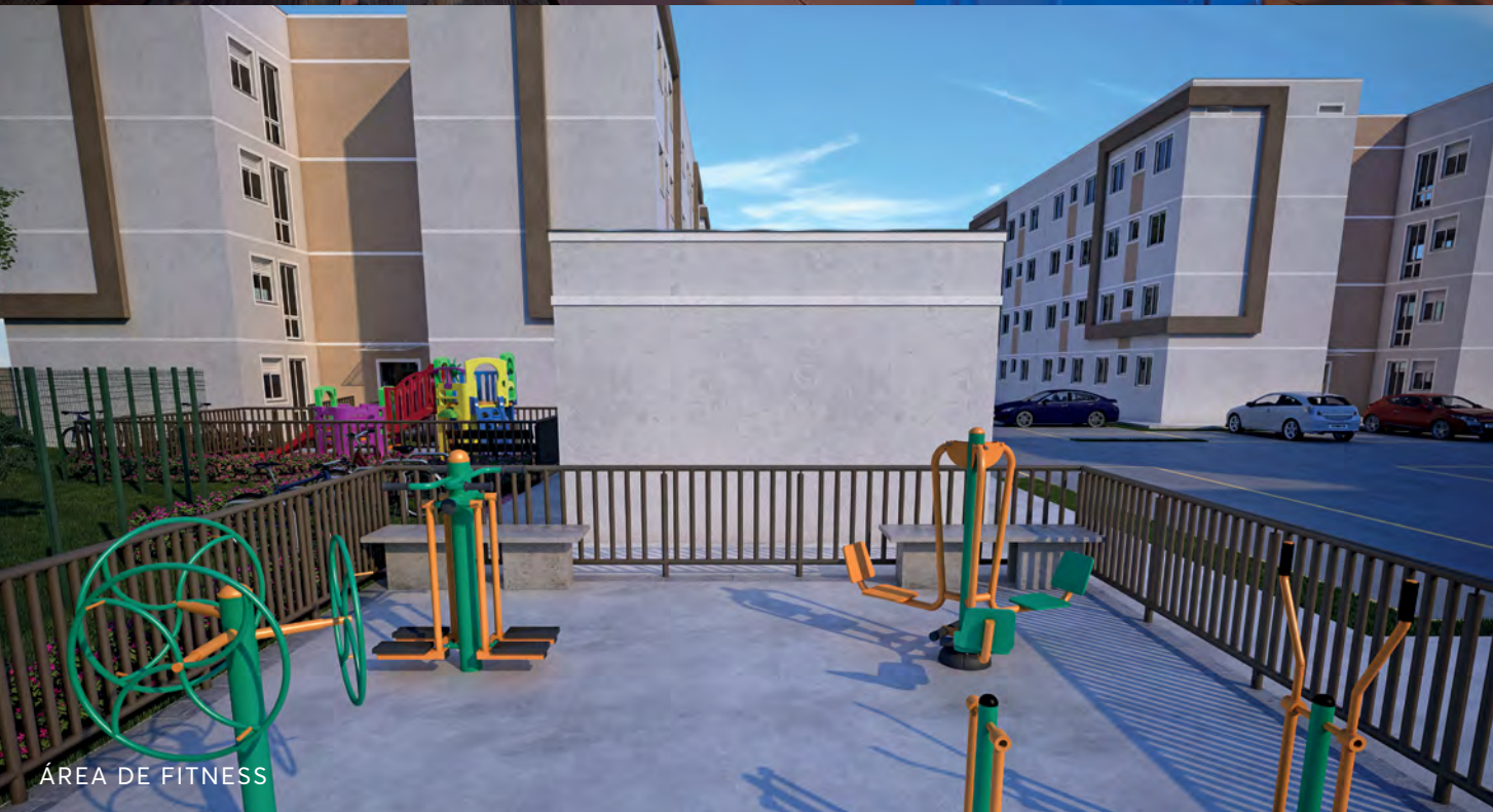
ÁREA DE FITNESS

Esta ilustração tem caráter exclusivamente promocional por se tratar de bem a ser construído. - Os materiais e cores representados poderão sofrer pequenas alterações em função da disponibilidade no mercado. - A decoração é mera sugestão, assim como os móveis, a bancada e passa-prato. - Não fazem parte dos apartamentos: os acabamentos de piso e bancadas que poderão ser adquiridos no Kit acabamento. - Esta planta poderá sofrer variações decorrentes do atendimento das posturas municipais ou andamento da obra.