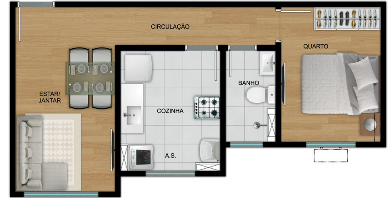
APARTAMENTO 104 - TORRE 01

UNIDADE INTERNA DE AR-CONDICIONADO SPLIT INSTALADA PELO CLIENTE UNIDADE EXTERNA DE AR-CONDICIONADO SPLIT INSTALADA PELO CLIENTE