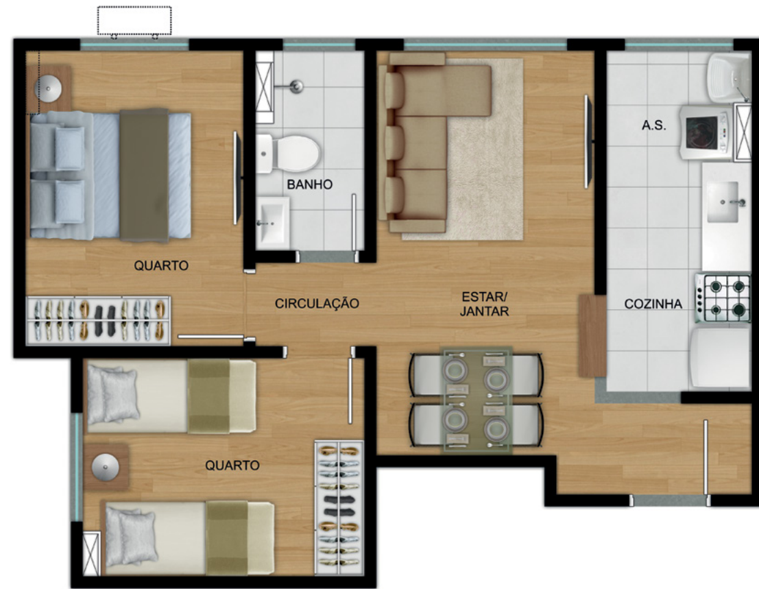
APARTAMENTO 201 - TORRE 01

UNIDADE INTERNA DE AR-CONDICIONADO SPLIT INSTALADA PELO CLIENTE UNIDADE EXTERNA DE AR-CONDICIONADO SPLIT INSTALADA PELO CLIENTE