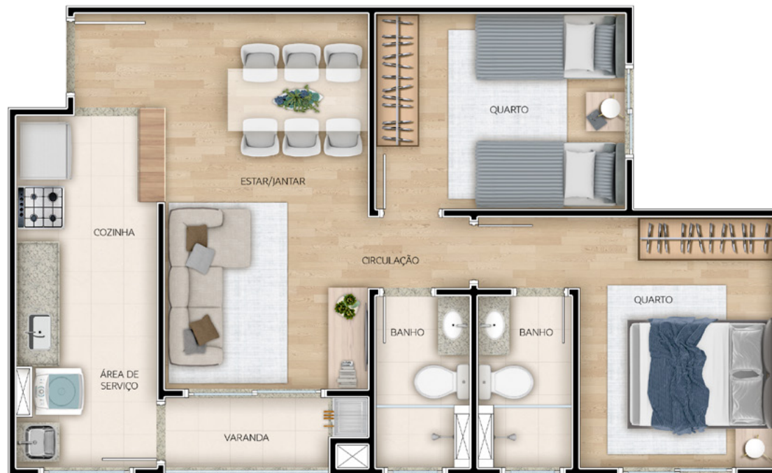
Ref.: Apto. 201 - Torre 3