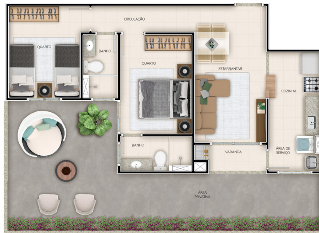
Ref.: Apto. 103 - Torre 3

A decoração é mera sugestão, esta planta poderá sofrer variações decorrentes do atendimento das posturas municipais, das concessionárias e do local. Não fazem parte do apartamento o acabamento dos pisos e bancadas, podendo ser adquiridos pelo Exclusivité.