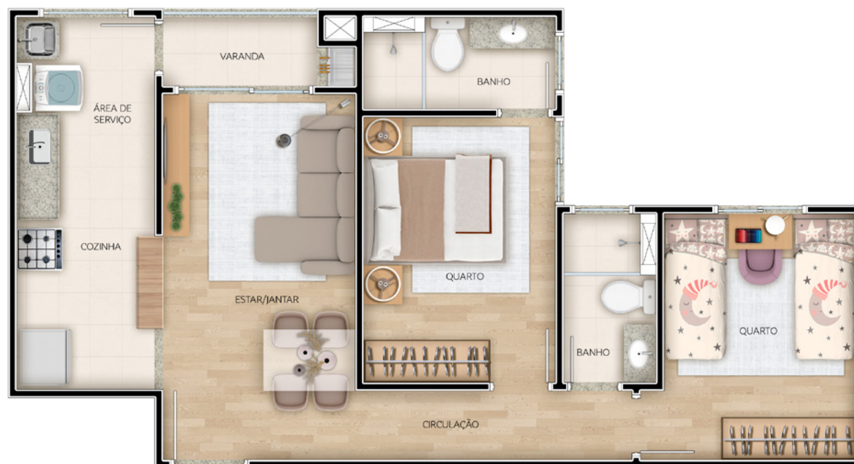
Ref.: Apto. 206 - Torre 3