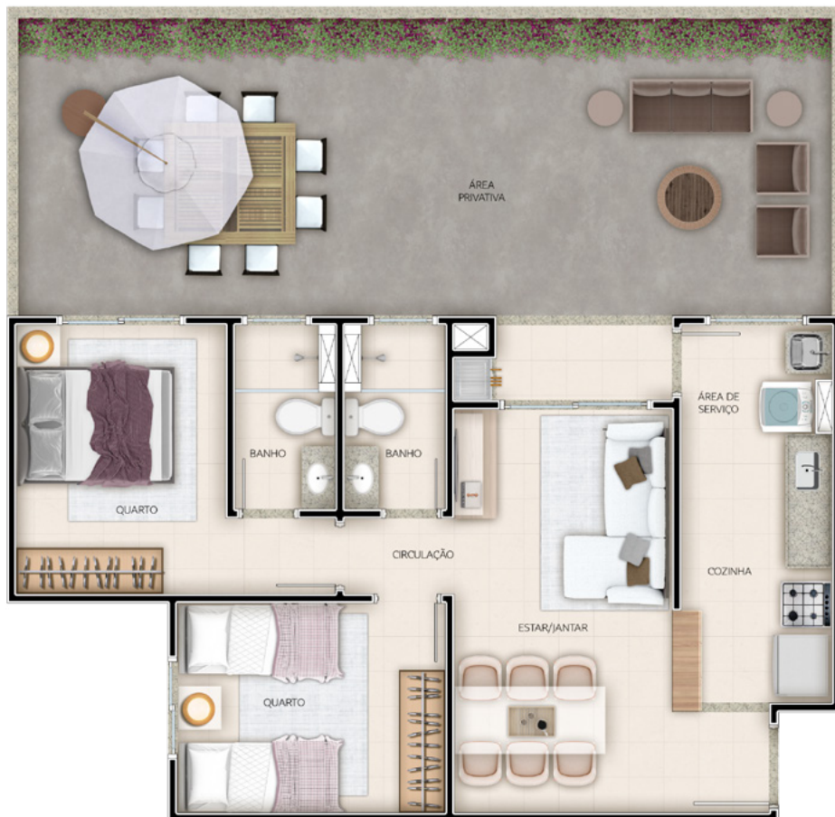
Ref.: Apto. 108 - Torre 3