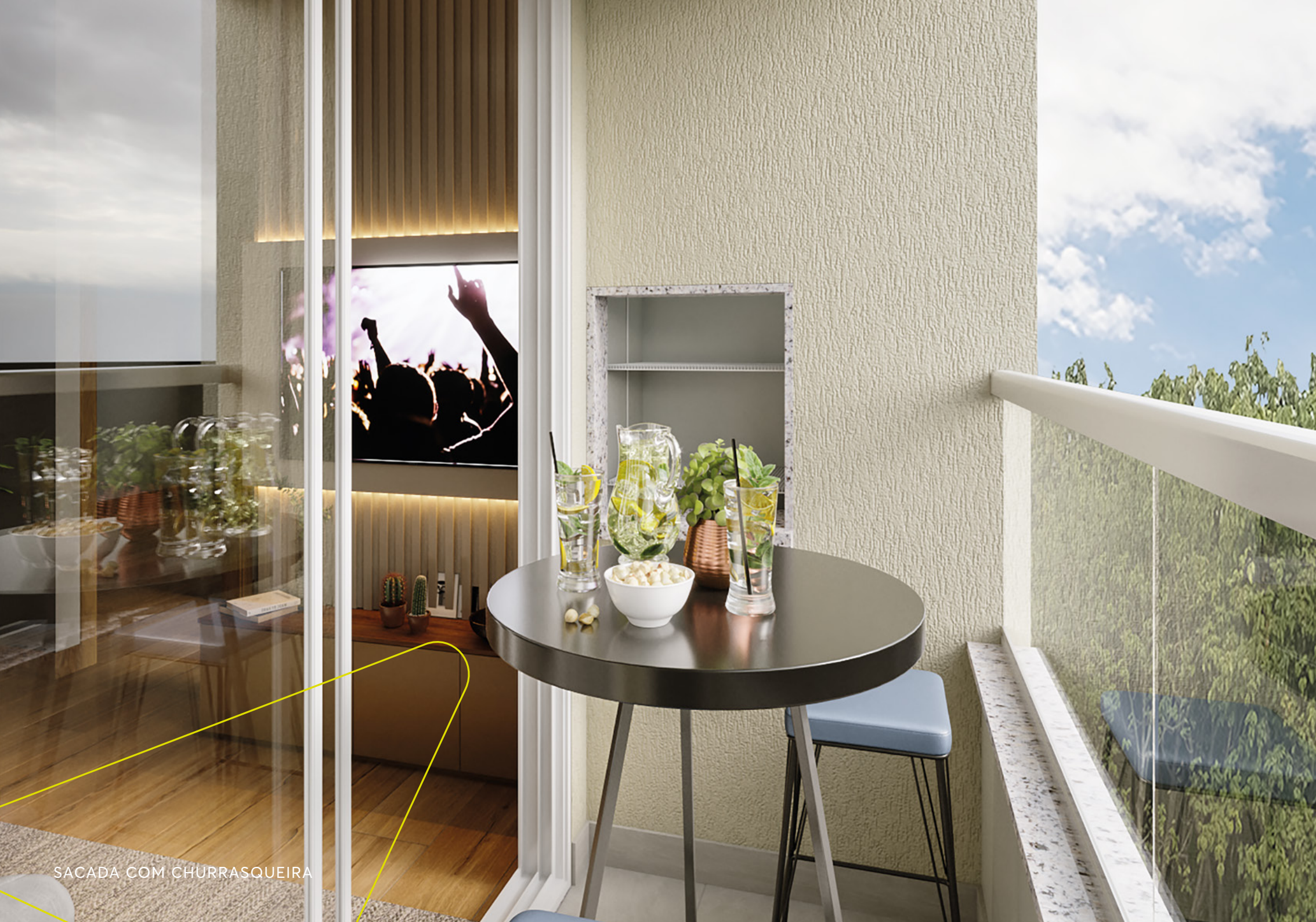
SACADA COM CHURRASQUEIRA