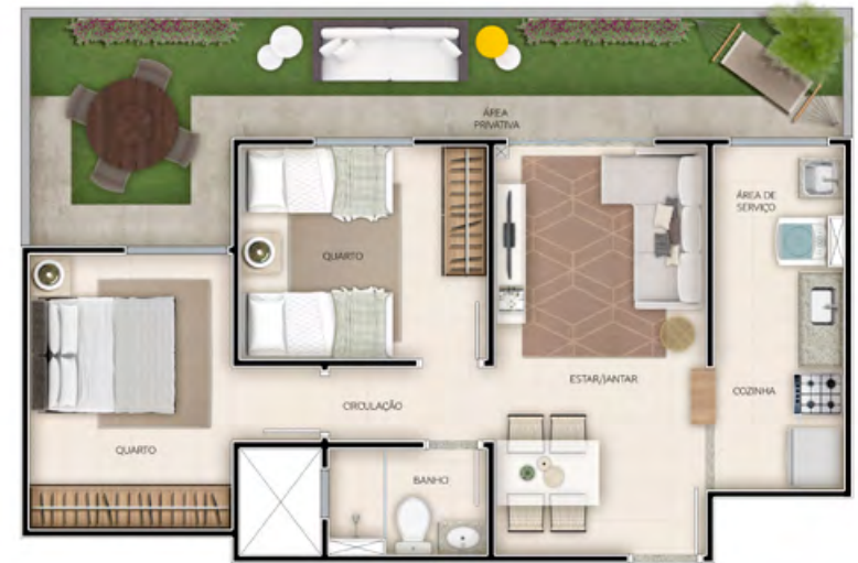
APTO 105 / TORRE 03