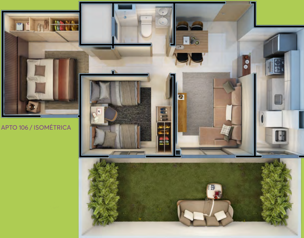
APTO 106 / ISOMÉTRICA