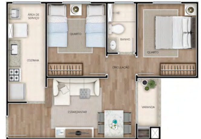
APTO 207 / TORRE 03

VERIFIQUE SE SEU EMPREENDIMENTO POSSUI PREVISÃO PARA AR CONDICIONADO NO MEMORIAL DESCRITIVO