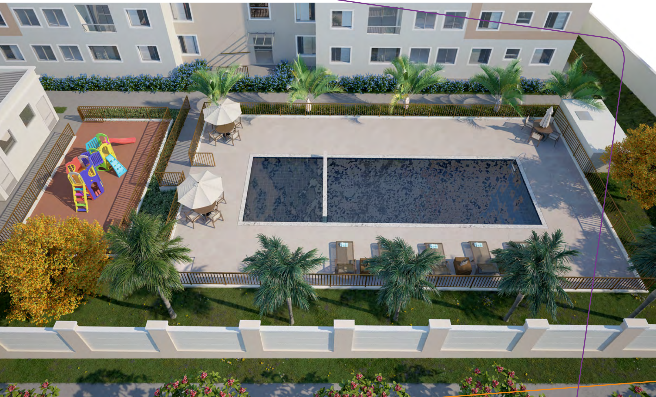
ÁREA DE LAZER