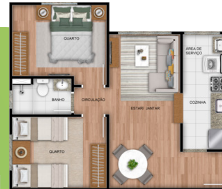
Apto. 204 - Torre 1

Viva a funcionalidade de cada cantinho do seu lar.