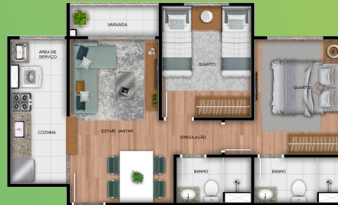
Apto. 205 - Torre 1

A decoração é mera sugestão, esta planta poderá sofrer variações decorrentes do atendimento das posturas municipais, das concessionárias e do local. As cotas são medidas de eixo a eixo das paredes. Não fazem parte do apartamento o acabamento dos pisos e bancadas, podendo ser adquiridos pelo Exclusivista.