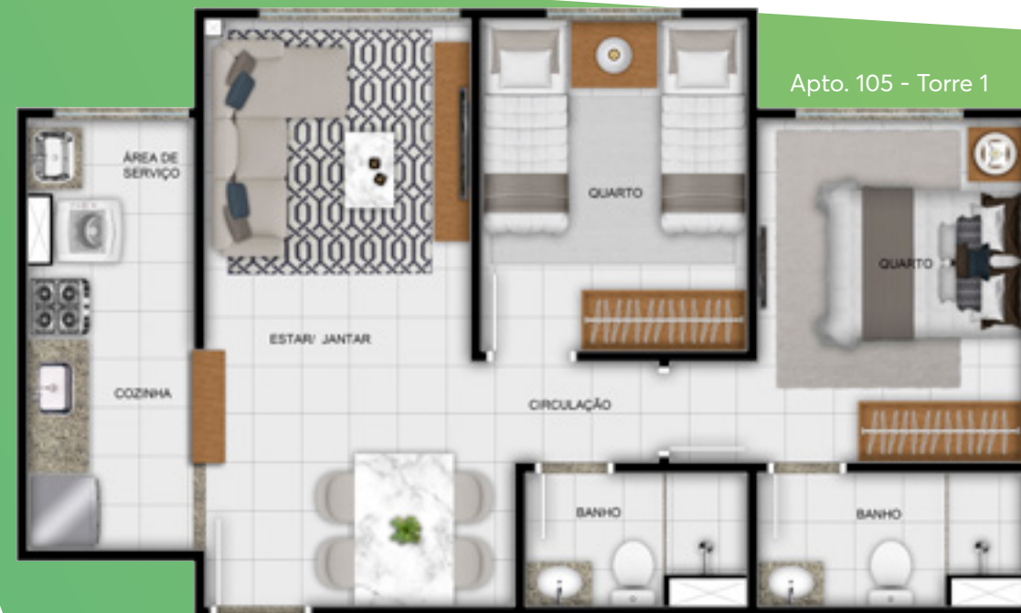
Apto. 105 - Torre 1

Viva a funcionalidade de cada cantinho do seu lar.