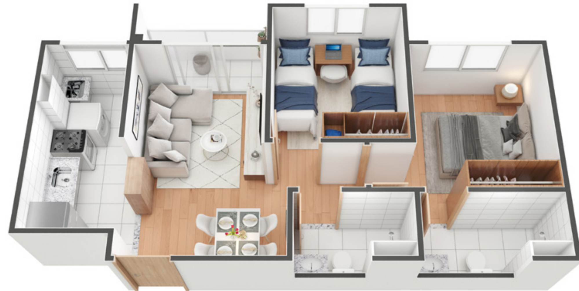
Apto. 205 - Torre 1

A decoração é mera sugestão, esta planta poderá sofrer variações decorrentes do atendimento das posturas municipais, das concessionárias e do local. As cotas são medidas de eixo a eixo das paredes. Não fazem parte do apartamento o acabamento dos pisos e bancadas, podendo ser adquiridos pelo Exclusivista.