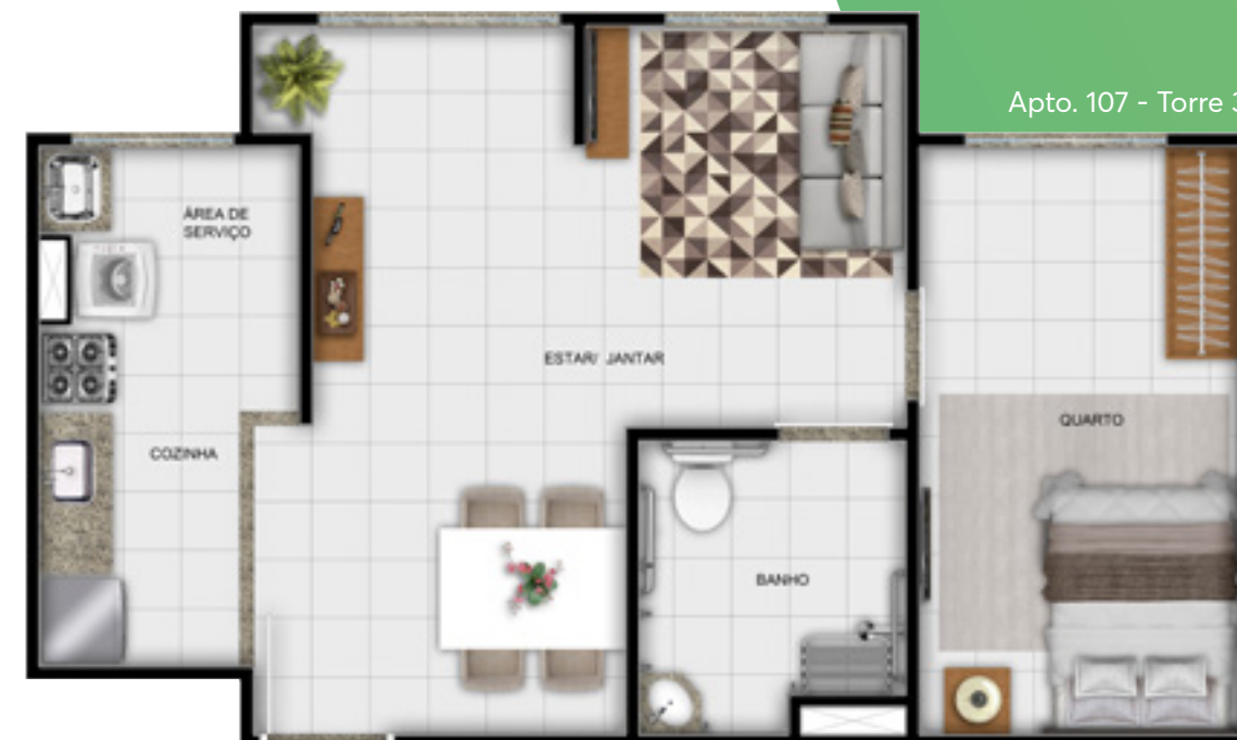
Apto. 107 - Torre 3