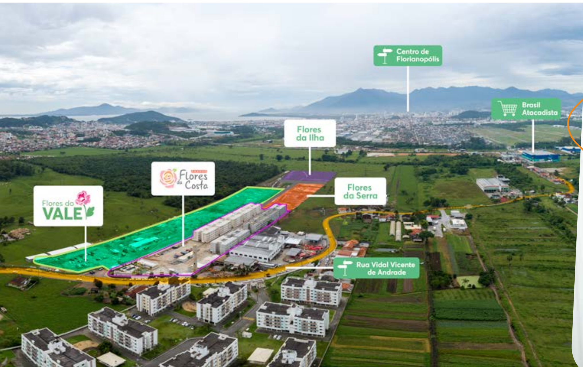
Foto aérea do local