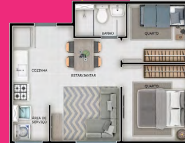
Apto 208 | Torre 03

ETE Estação de Tratamento de Esgoto - ETE Manutenção de responsabilidade do Condomínio. CASTELO D'ÁGUA Castelo D'água. Manutenção de responsabilidade do Condomínio. AR CONDICIONADO Infraestrutura para ar condicionado. Aparelho e instalação não inclusos. ÁGUA INDIVIDUALIZADA Preparação para medição de água individualizada. Ligação e cobranças individualizadas conforme regras da concessionária local. VAGA PCD Vaga destinada à Pessoas com Deficiência, em cumprimento à Lei de Acessibilidade.