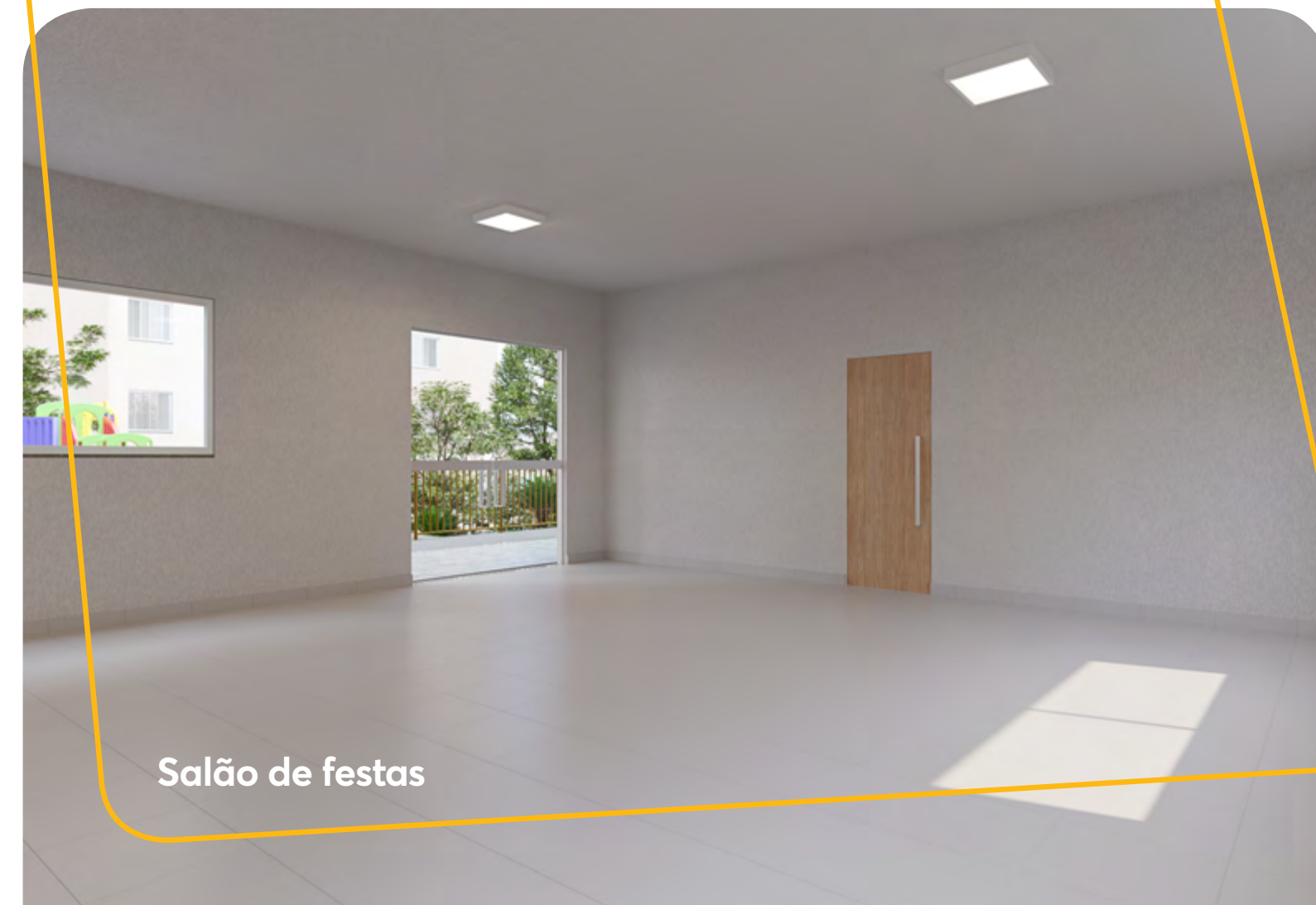
Salão de festas

Adicione novas alegrias e sabores ao seu dia a dia.