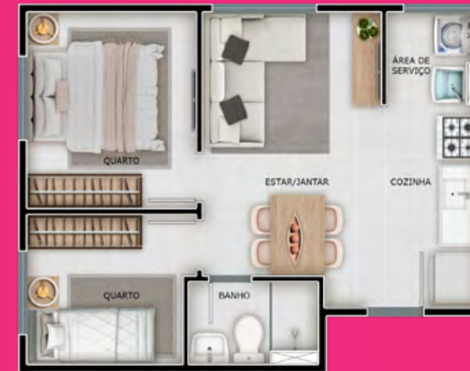
Apto 201 | Torre 02