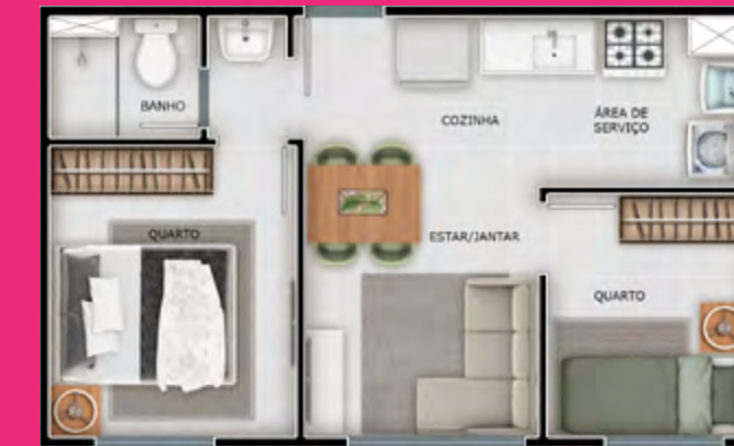
Apto 206 | Torre 03