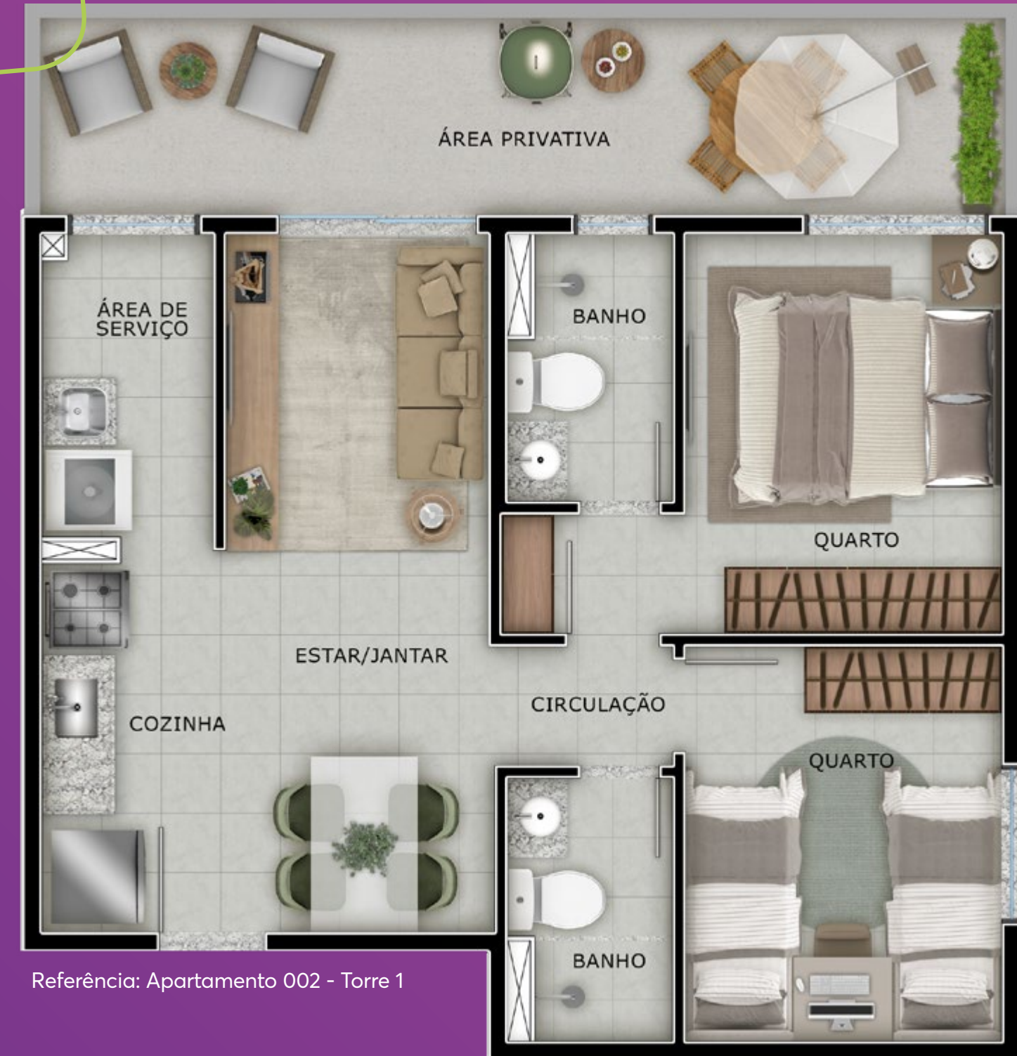
Referência: Apartamento 002 - Torre 1