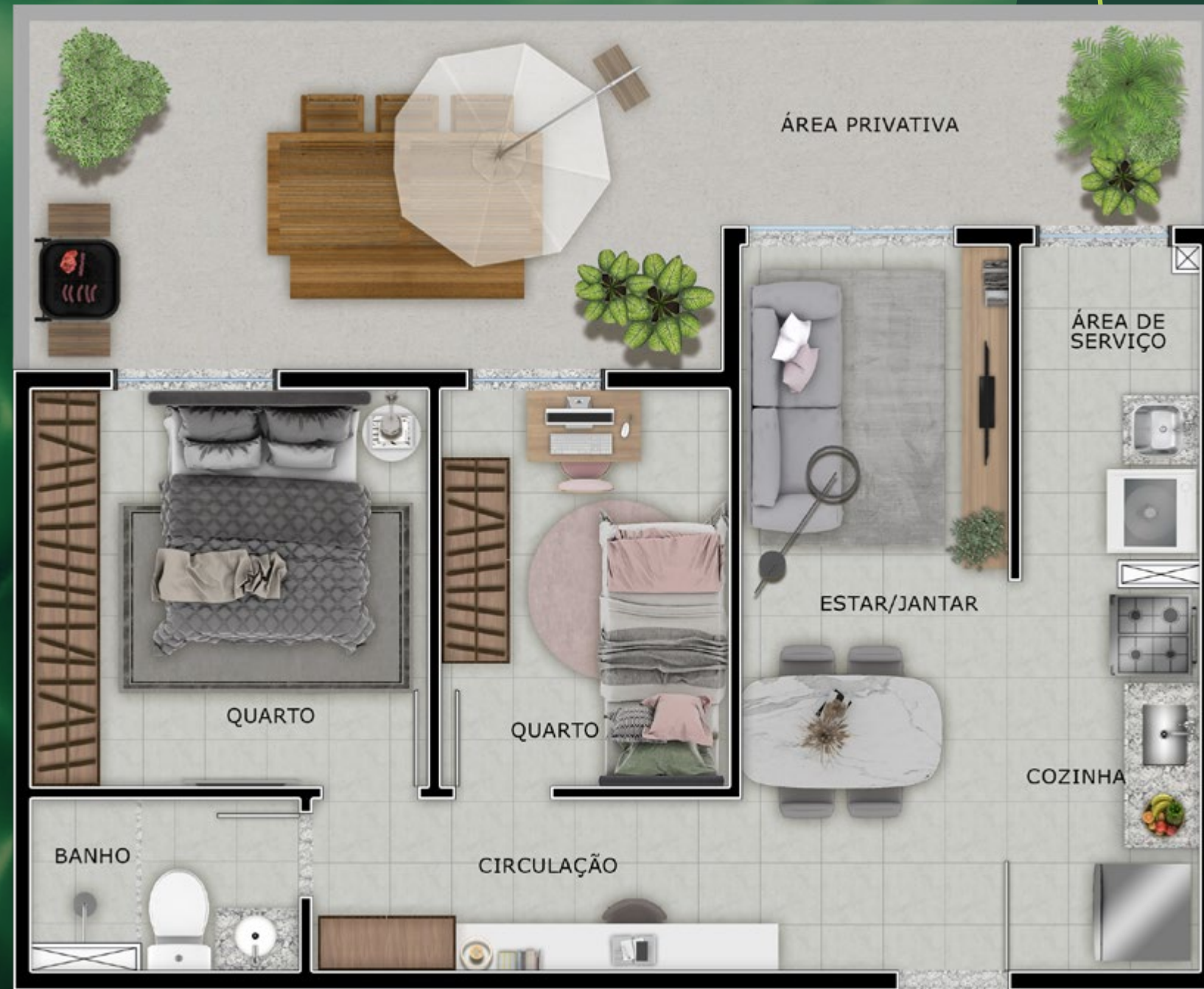
Referência: Apartamento 004 - Torre 1