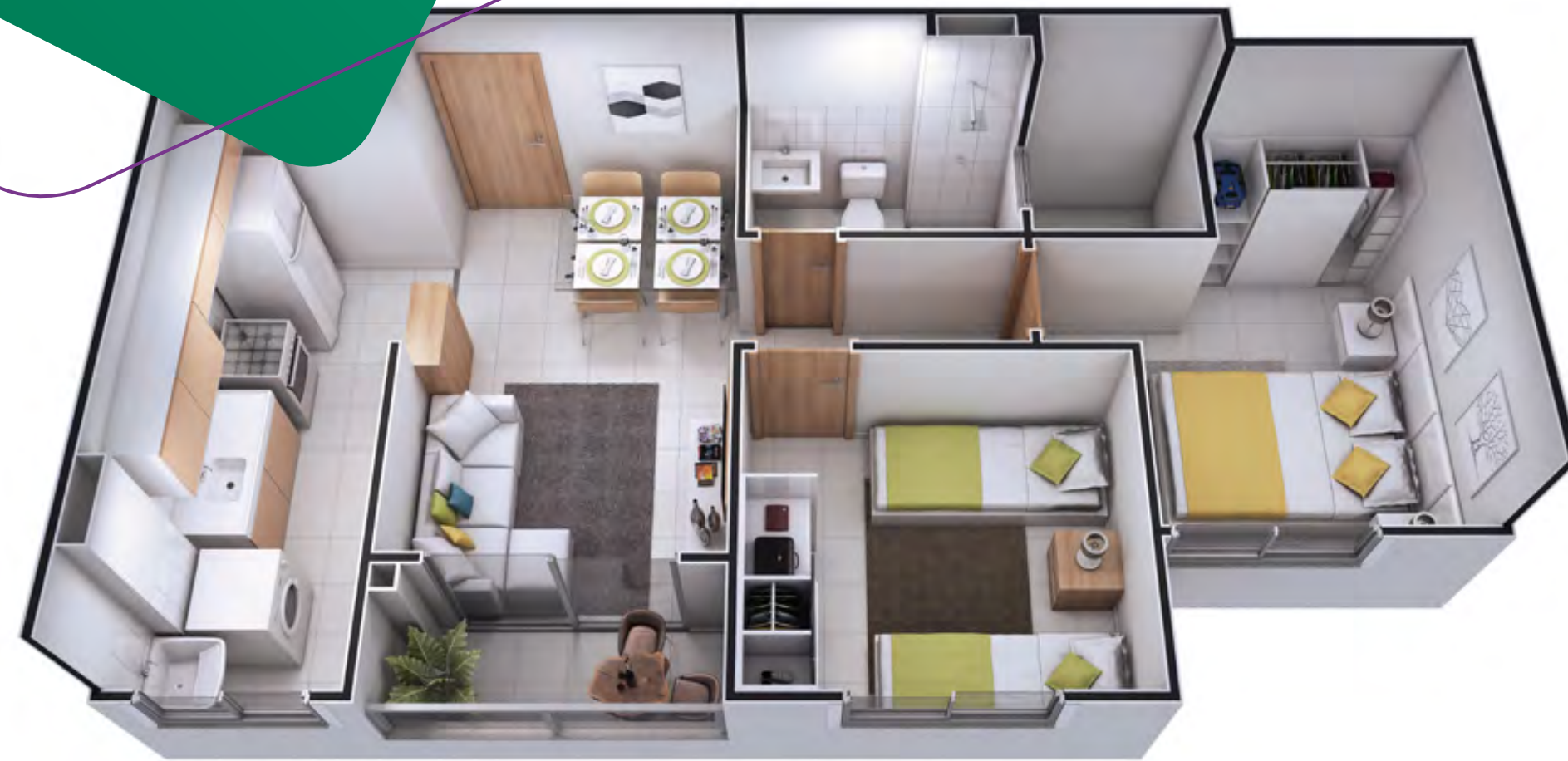
Apto 204 - Torre 4

A FUNCIONALIDADE QUE COMBINA COM O SEU ESTILO DE VIVER.