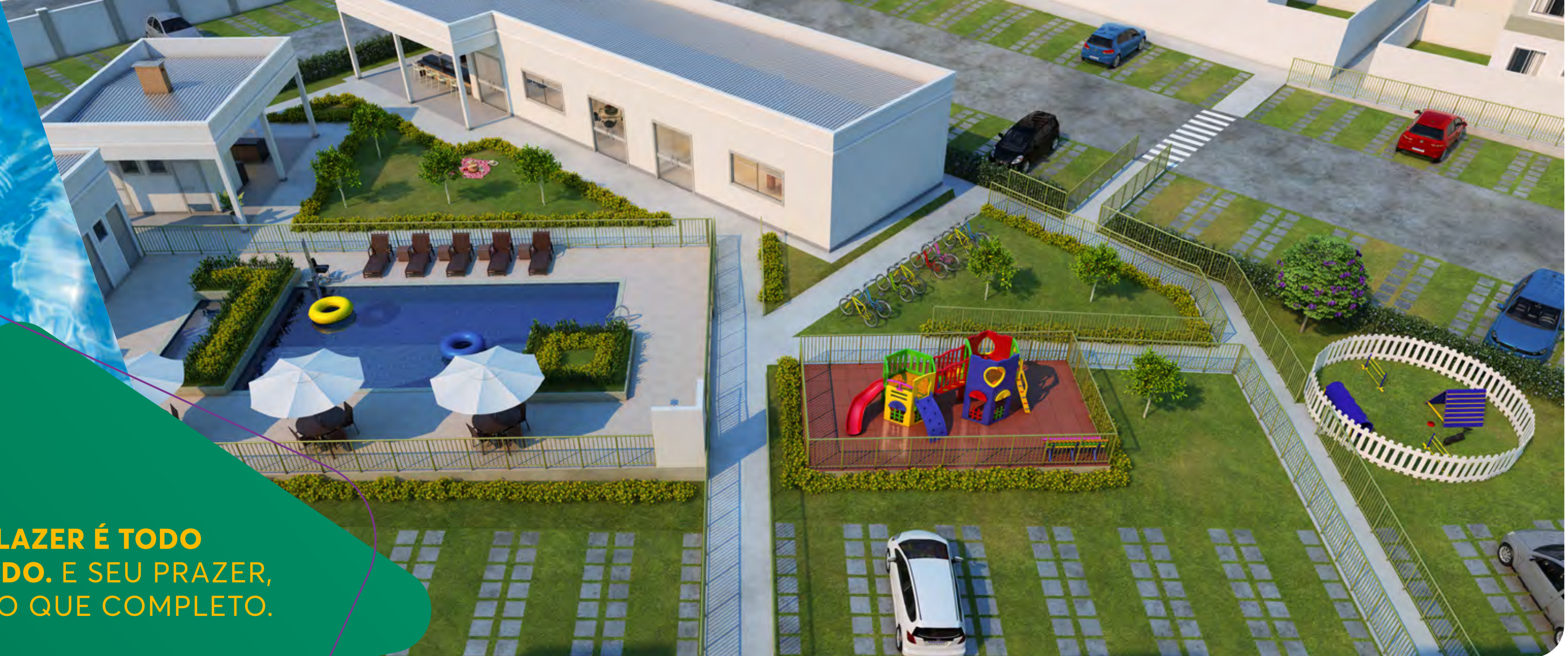
IMPLANTAÇÃO LAZER 3D

O LAZER É TODO EQUIPADO. E SEU PRAZER, MAIS DO QUE COMPLETO.