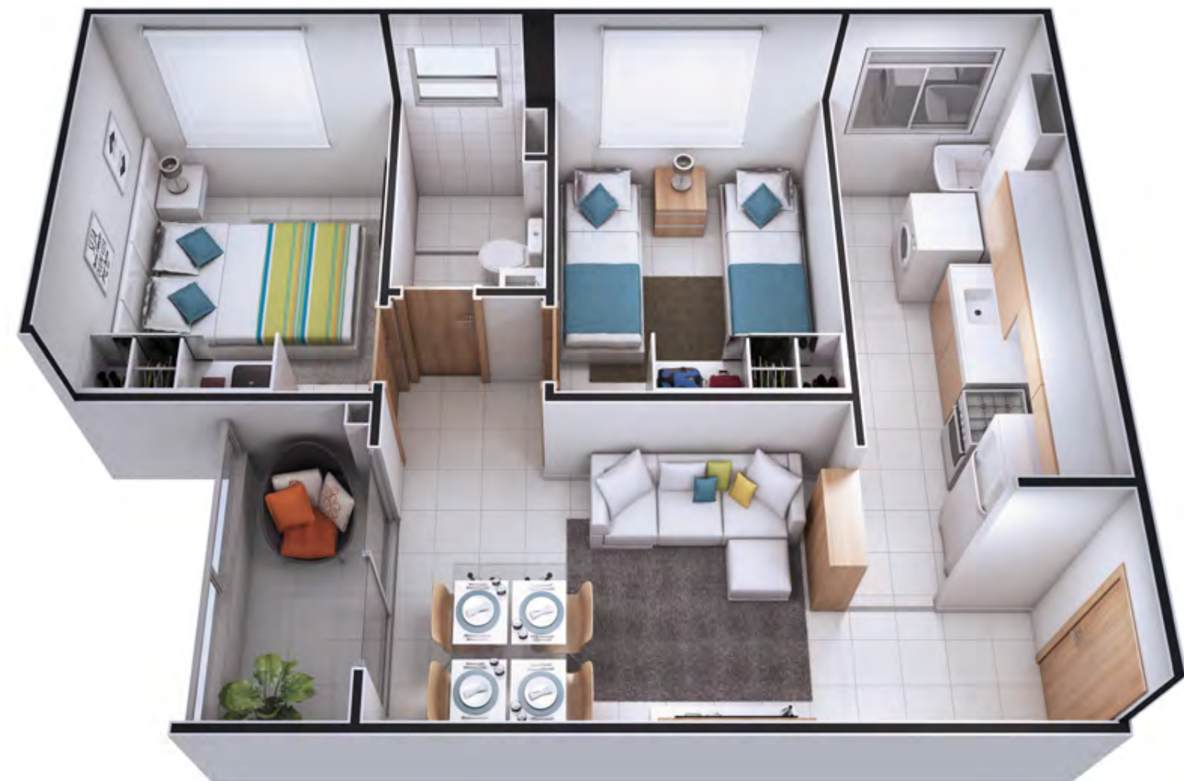
Apto 201 - Torre 4

A FUNCIONALIDADE QUE COMBINA COM O SEU ESTILO DE VIVER.