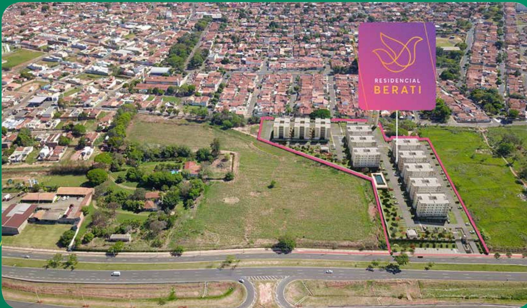
Foto aérea do local