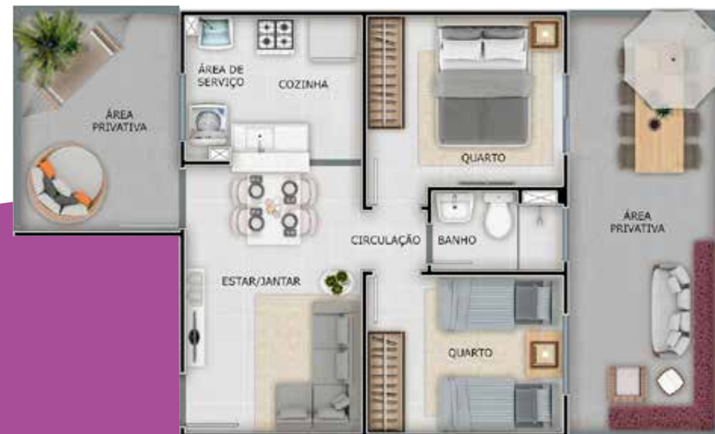
Apto. 103 | Bloco 17