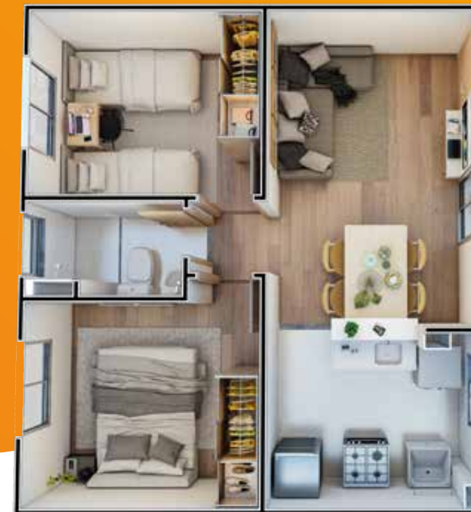
Apto. 202 | Bloco 17