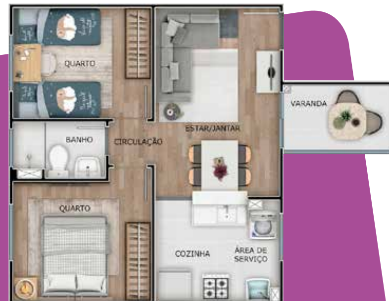
Apto. 202 | Bloco 17