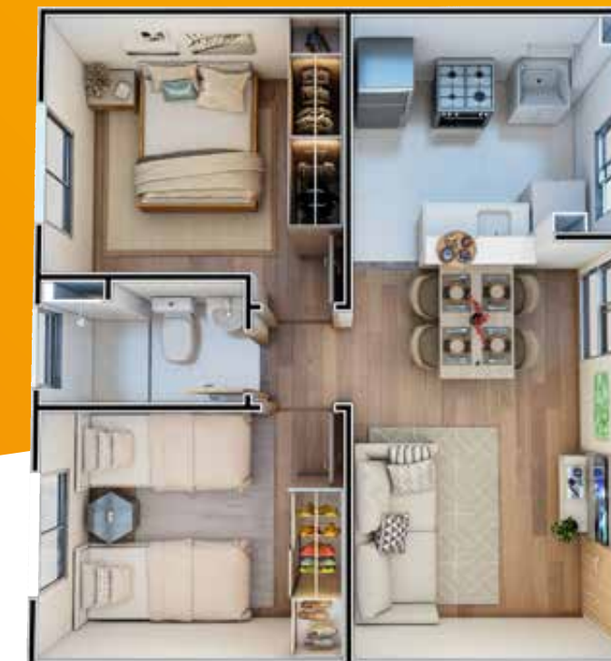
Apto. 201 | Bloco 17

Imagem ilustrativa com sugestão de decoração. Os móveis, objetos, revestimentos e demais acabamentos não fazem parte do Contrato. O empreendimento e suas unidades serão entregues conforme Memorial Descritivo. Imagem sujeita a alterações devido ao desenvolvimento do projeto e compatibilizações técnicas. Interfone: será instalado sistema de intercomunicação entre guarita e unidades privativas que funcionará através da rede telefonia móvel disponível no local (para este caso a responsabilidade de contratação da operadora de telefonia e do aparelho será do cliente) ou sistema tradicional com cabeamento (nesse caso será entregue um aparelho de interfone por apartamento). Independente do sistema utilizado as tubulações seca e sondada serão entregues (sem fiação). Será deixada uma previsão de ponto de interfone para elevador (ou para previsão de elevador) no primeiro andar ou no térreo, no hall de escada sem acesso a guarita. Consulte condições de financiamento do Programa Casa Verde e Amarela e avalie se você preenche os critérios para concessão dos benefícios. AR CONDICIONADO: Infraestrutura para ar condicionado. Aparelho e instalação não inclusos.