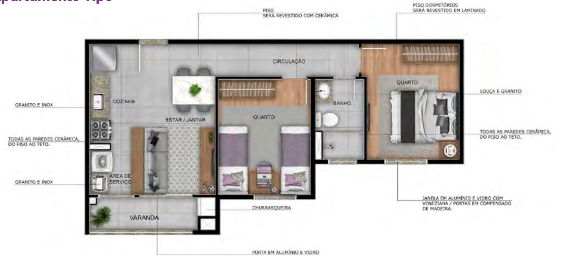
Apto. 205 - Torre 01