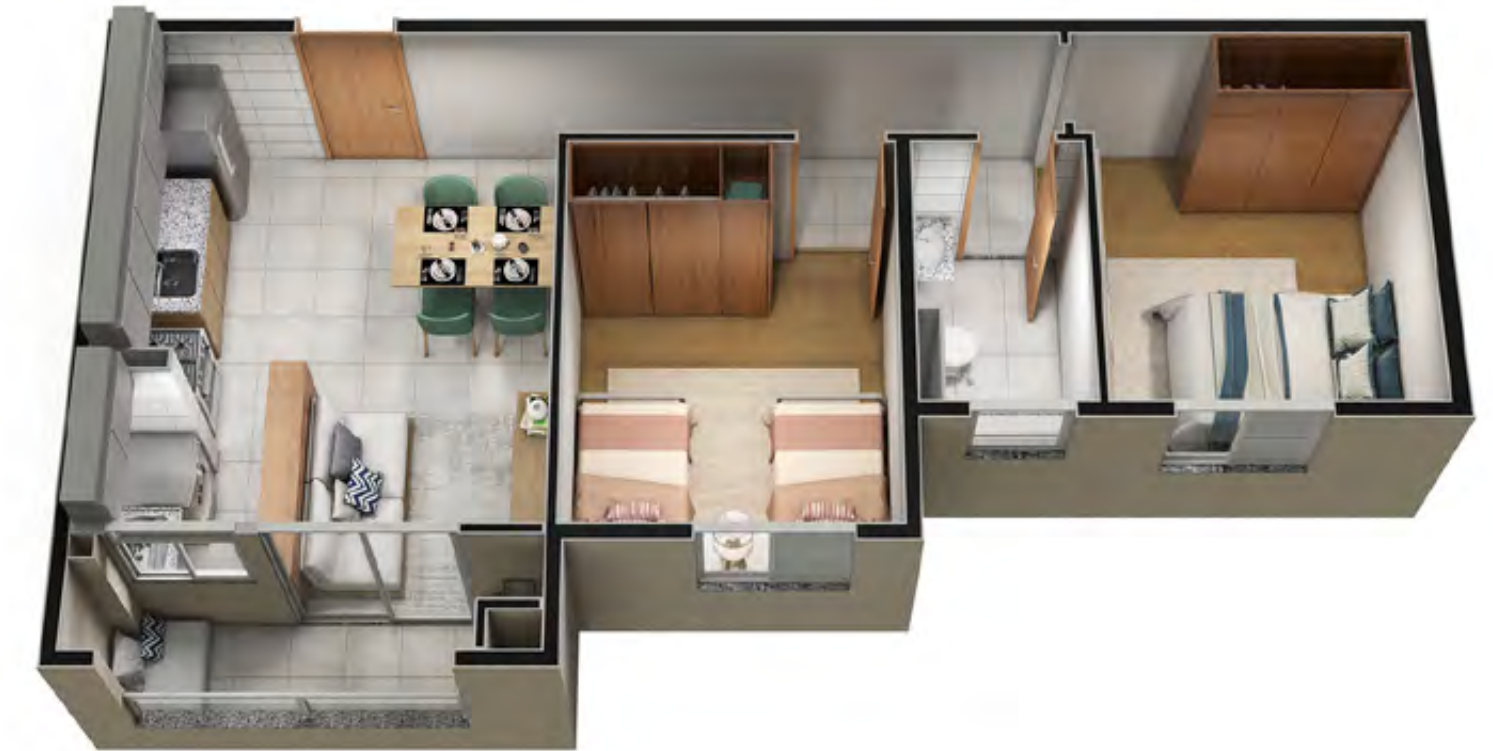
Apto. 205 - Torre 01