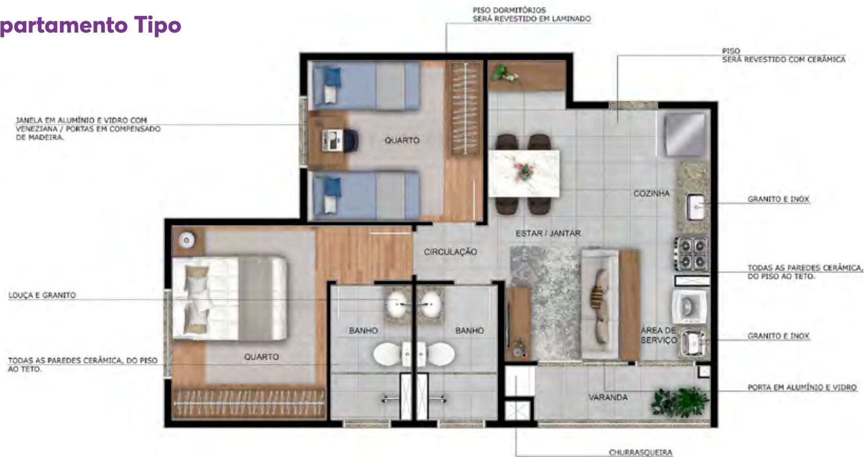
Apto. 507 - Torre 01