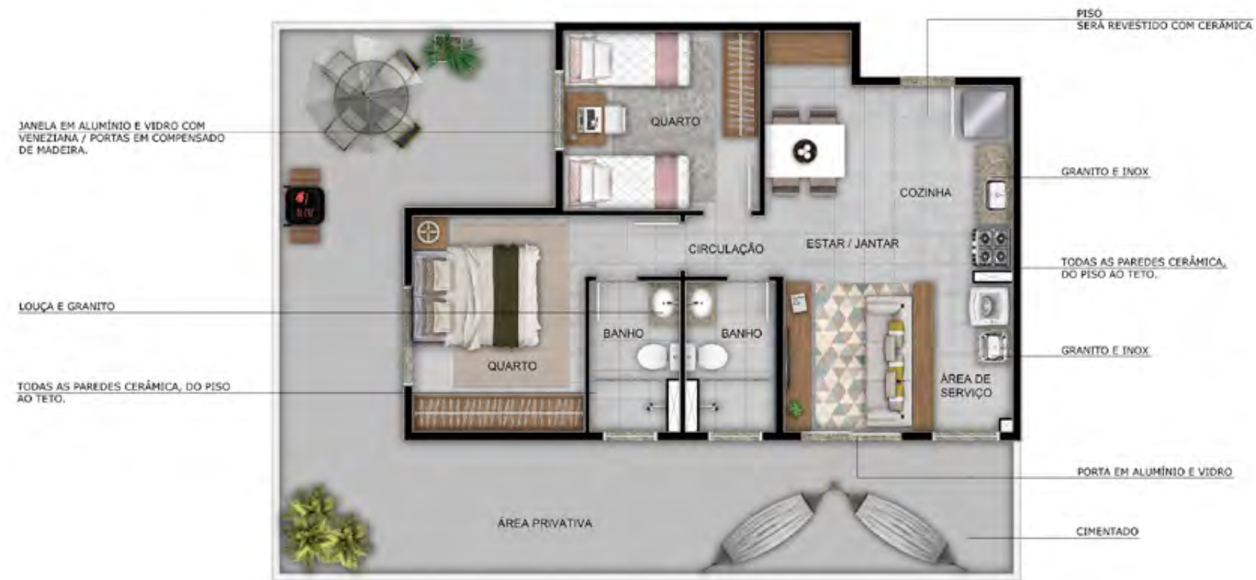
Apto. 107 - Torre 01