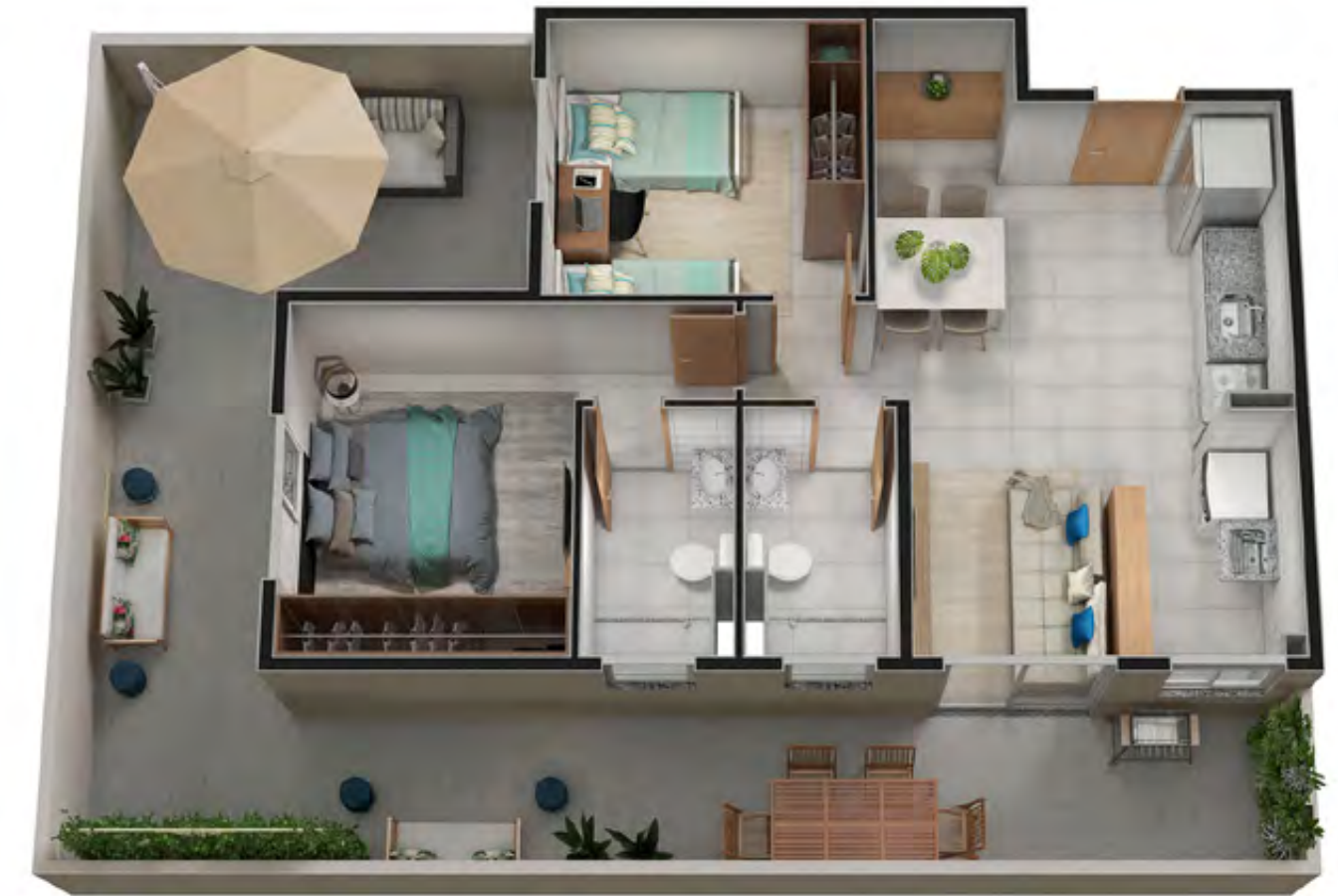
Apto. 107 - Torre 01