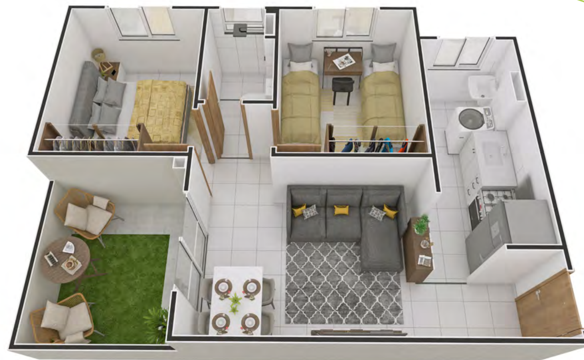
Apto. 101 - Torre 04