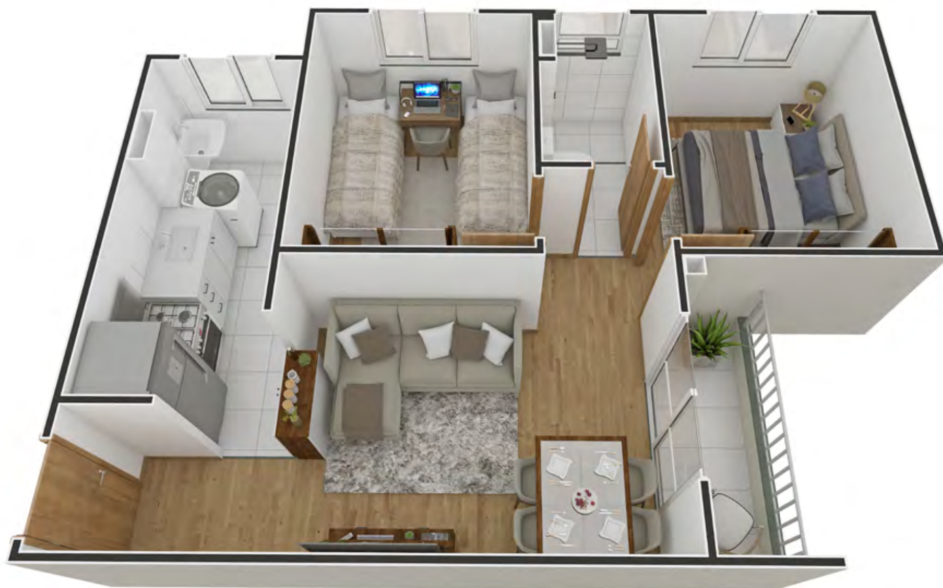
Apto. 207 - Torre 04