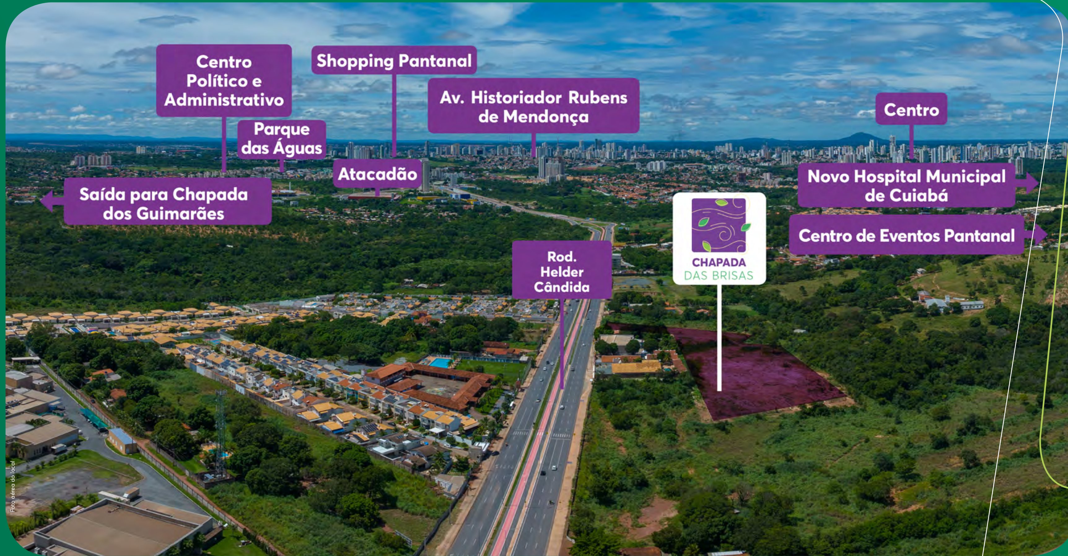
Foto aérea do local

Viva com o melhor da região do Ribeirão do Lipa, pertinho de você.