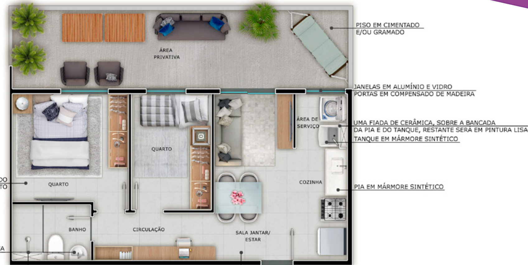
Apto. 001 - Torre 02