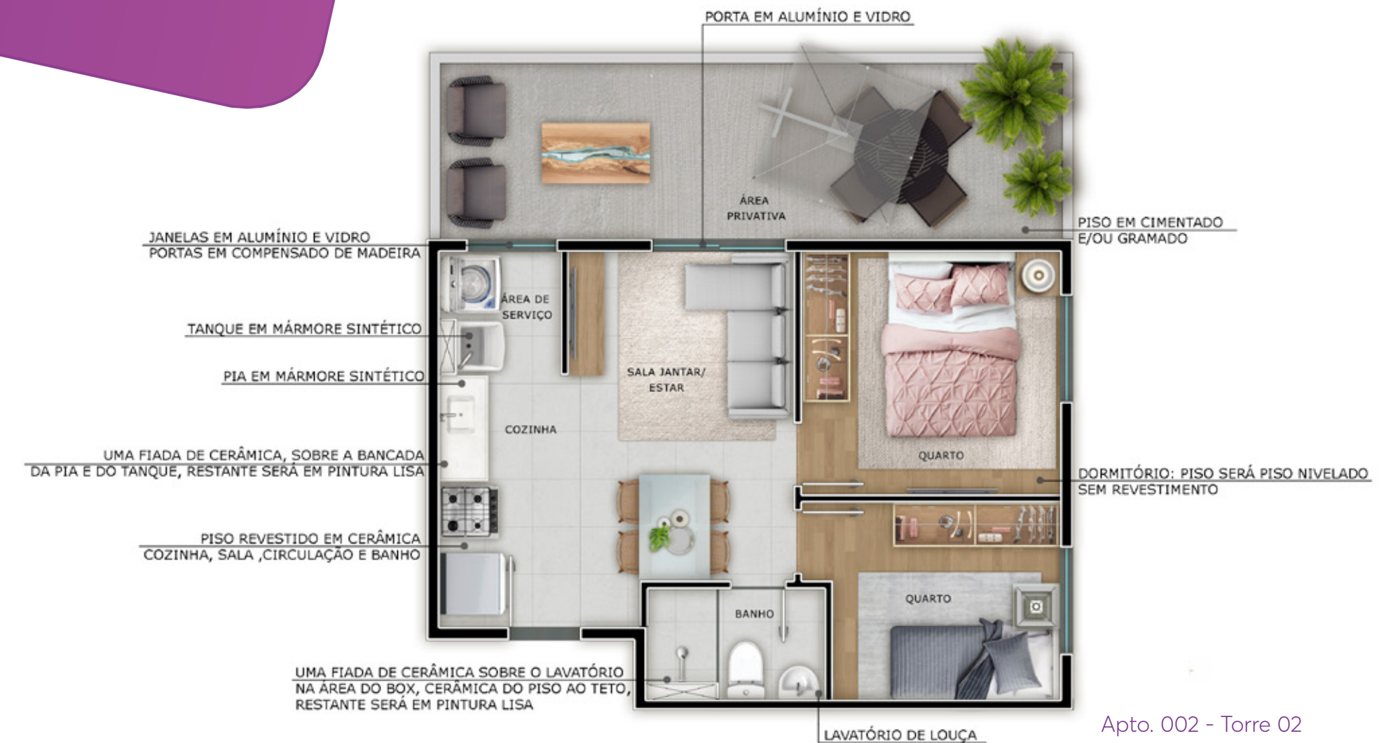
Apto. 002 - Torre 02

Imagem ilustrativa com sugestão de decoração. Os móveis, objetos, revestimentos e demais acabamentos não fazem parte do Contrato. O empreendimento e suas unidades serão entregues conforme Memorial Descritivo. Imagem sujeita a alterações devido ao desenvolvimento do projeto e compatibilizações técnicas Interfone: será instalado sistema de intercomunicação entre guarita e unidades privativas que funcionará através da rede de telefonia móvel disponível no local. (para este caso a responsabilidade de contratação da operadora de telefonia e do aparelho será do cliente) ou sistema tradicional com cabeamento (nesse caso será entregue um aparelho de interfone por apartamento). Independente do sistema utilizado as tubulações seca e sondada serão entregues (sem fiação). Será deixada uma previsão de ponto de interfone para elevador (ou para previsão de elevador) no primeiro andar ou no térreo, no hall de escada sem acesso a guarita. Infraestrutura para ar condicionado. Aparelho e instalação não inclusos. Importante destacar que as unidades serão entregues no contrapiso